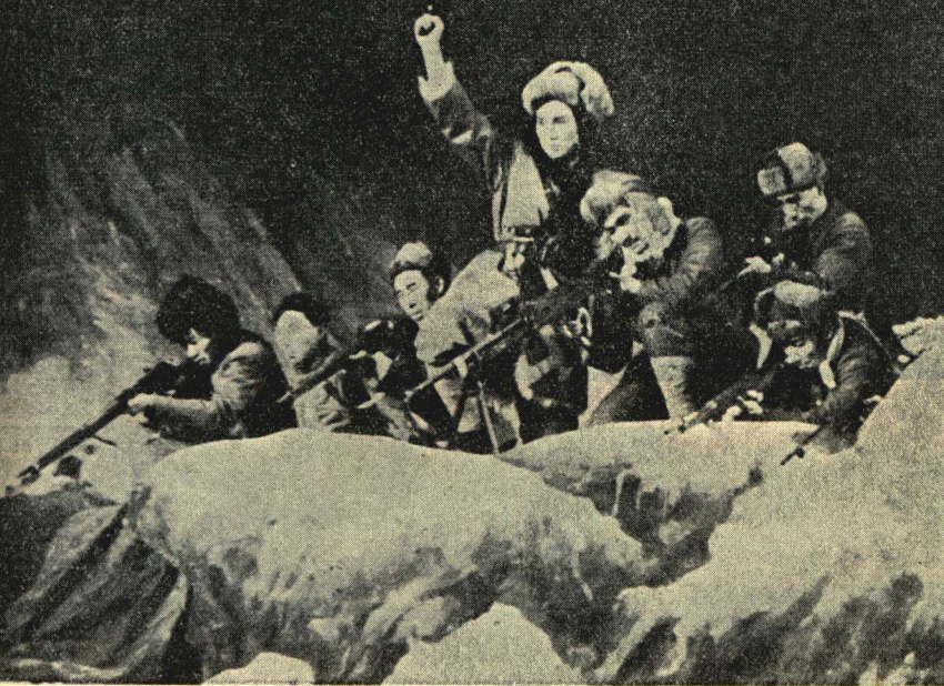
趙一曼(中，童芷苓飾)在指揮作戰的一個場面。