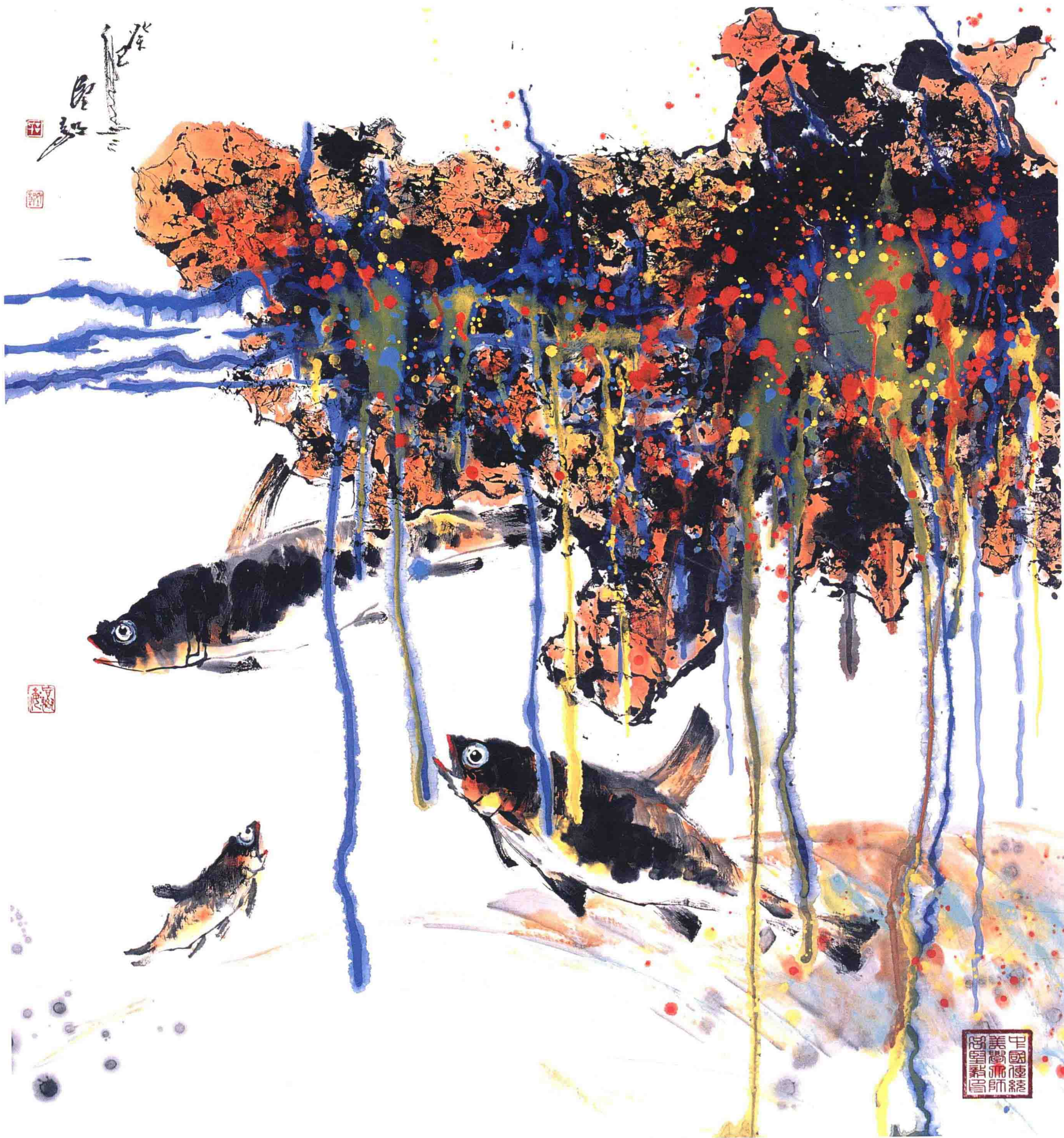
寻觅 97cm × 96cm