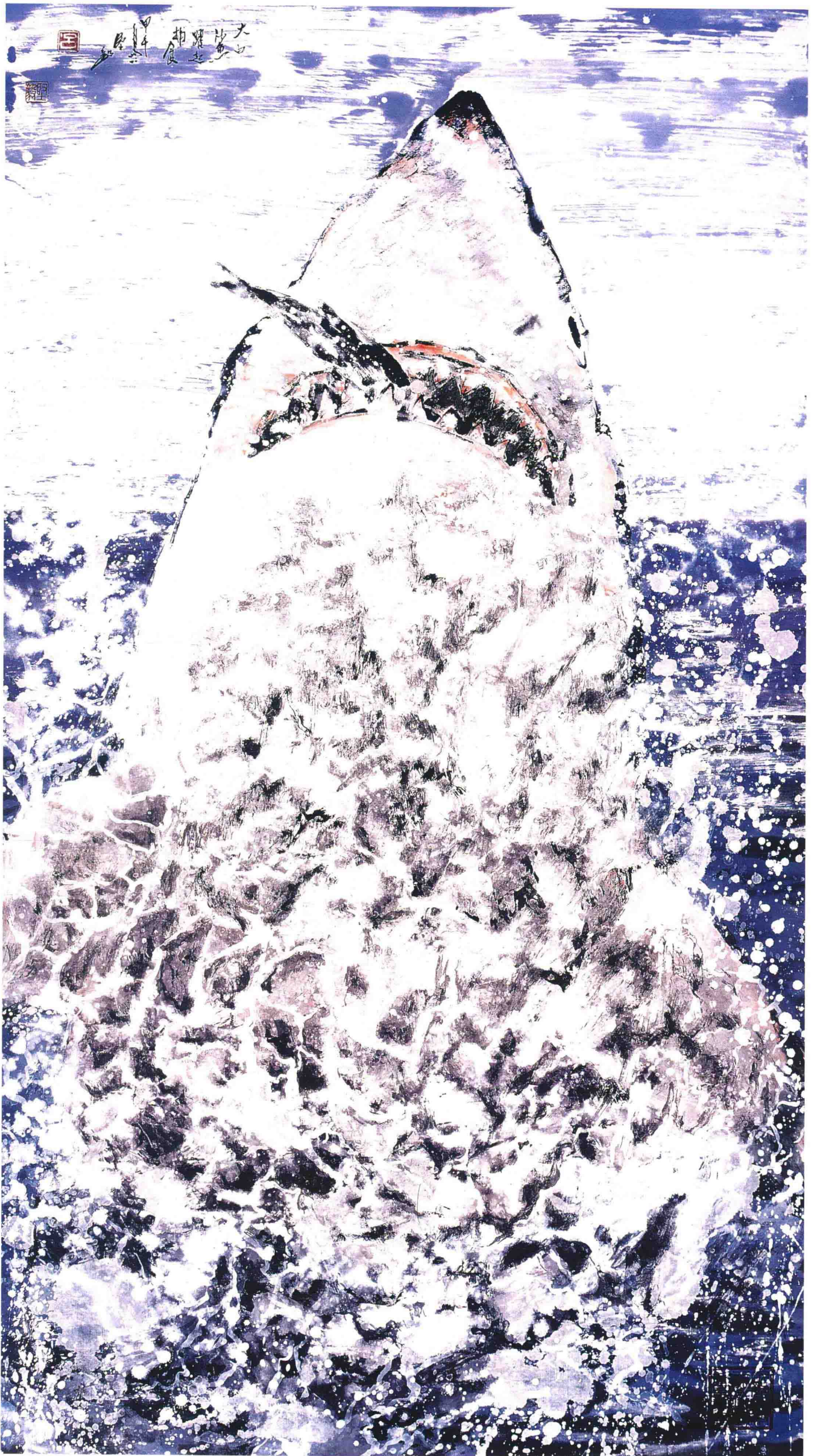
霸王 182cm X 96cm