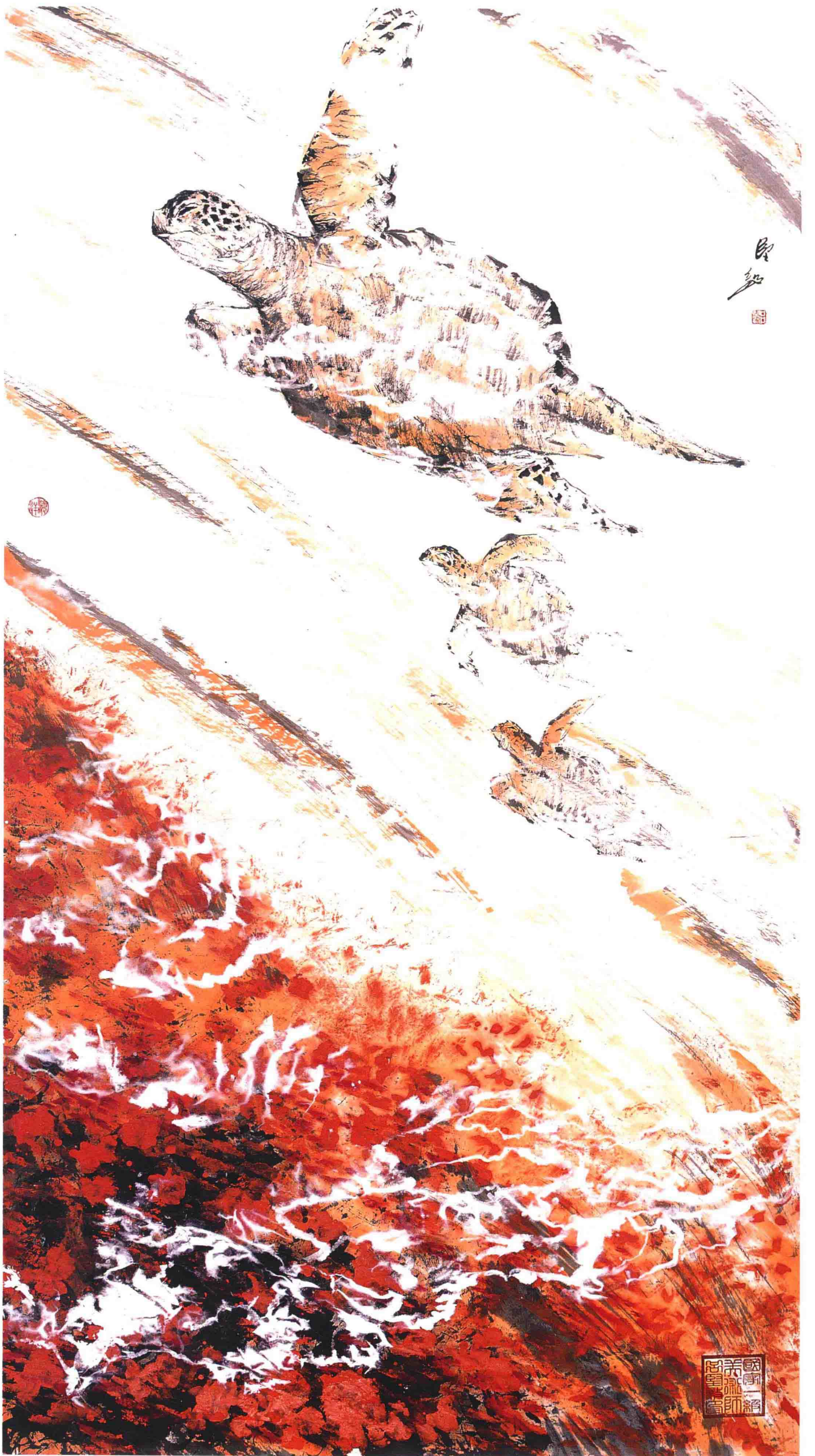
勇往直前 182cm x 96cm