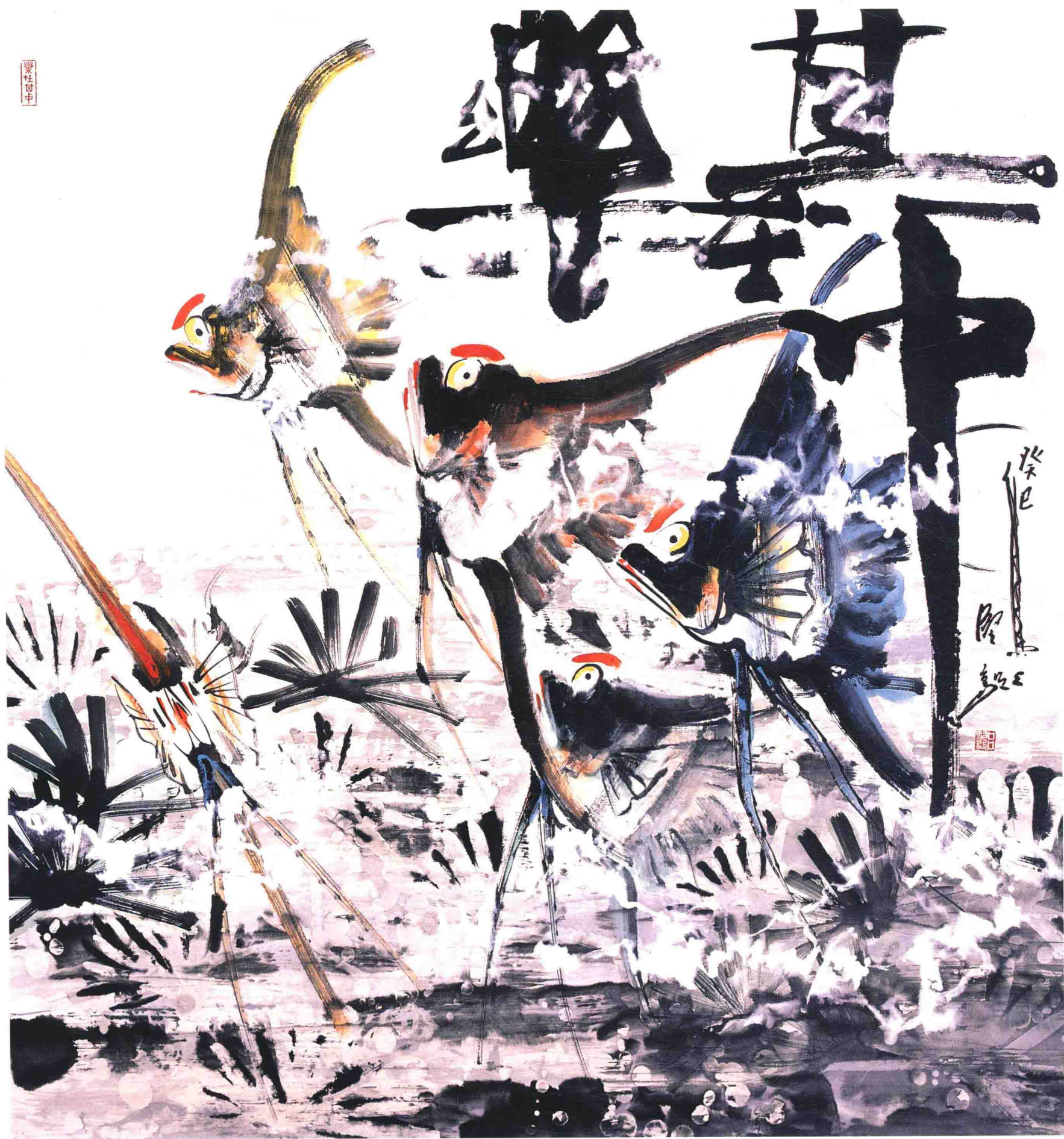
乐在其中之一 97cm × 96cm