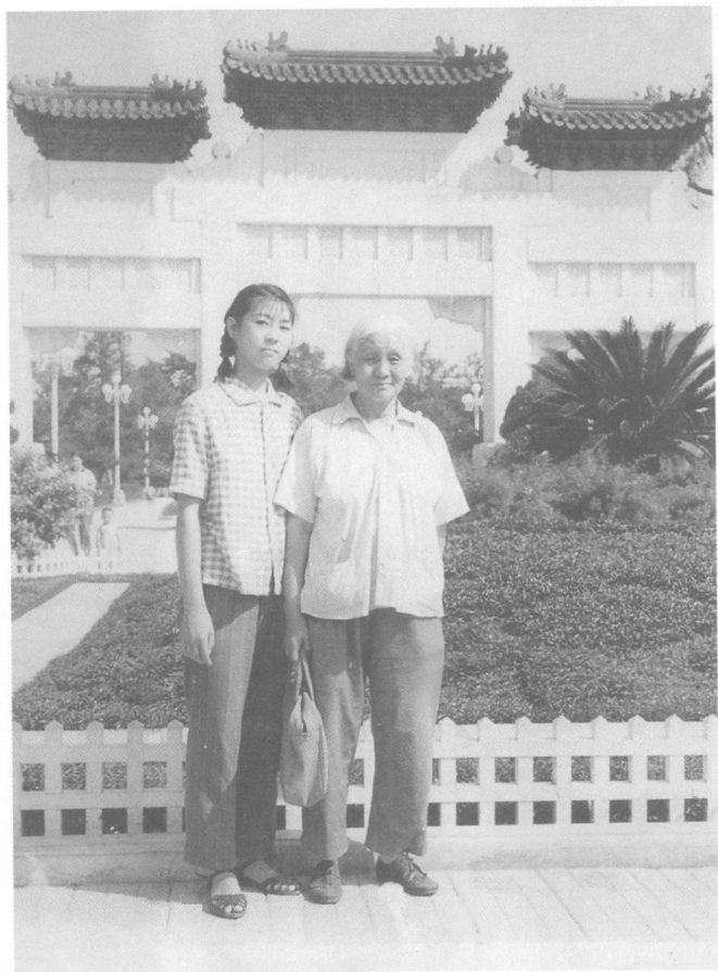
在中山公园和姥姥第一次也是最后一次合影