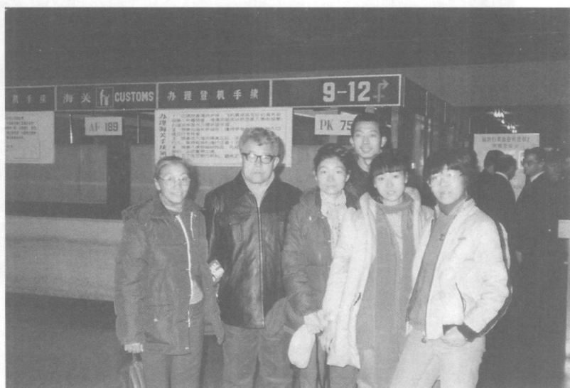
离开中国前和家人在机场合影