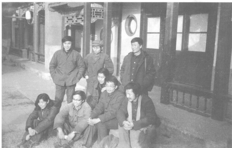
1980年星星部分成员在北海画坊斋合影