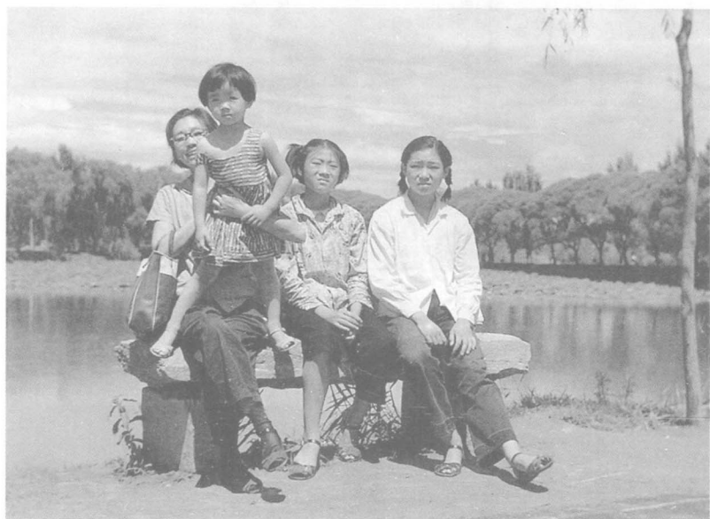
父亲解除关押后在玉渊潭给家人拍的合影