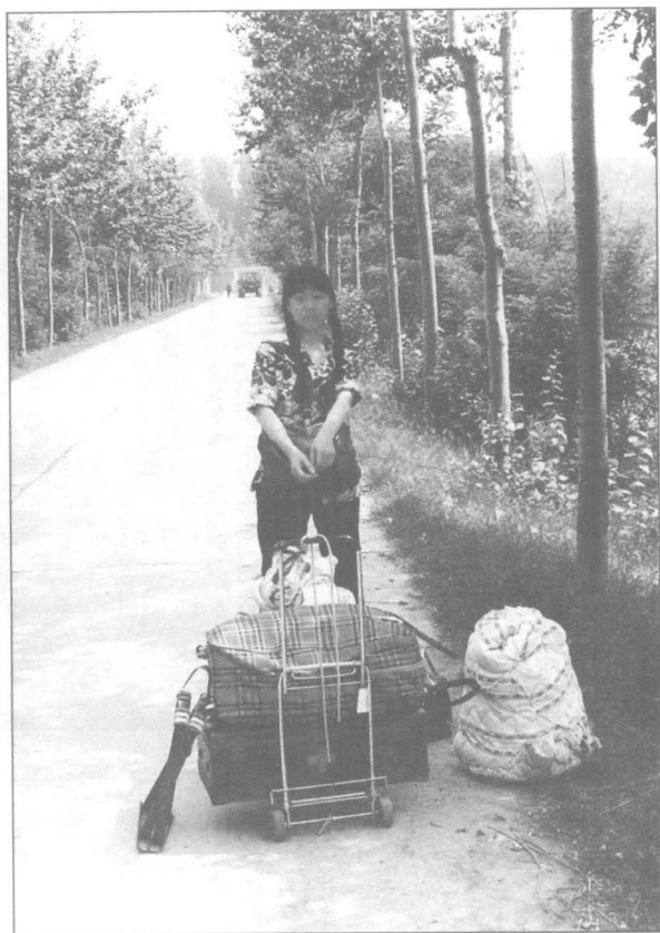
释放那天在良乡劳教所大门口稍远处