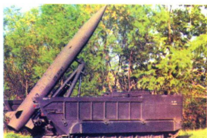
美国“长矛”战术导弹△