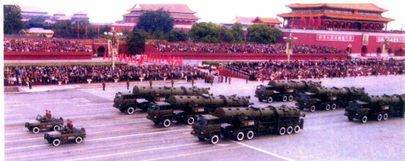
△ 国庆 50 周年时，中国战略导弹通过天安门广场