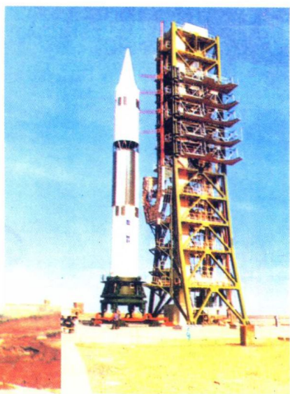
◁ MX 洲际导弹