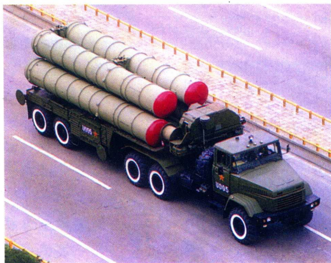
▽ 俄罗斯 C-300PMU 防空导弹