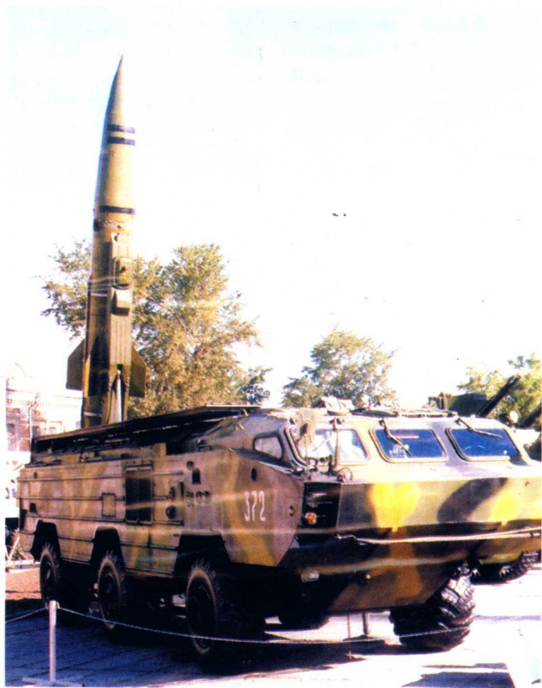
俄罗斯 SS-21 导弹