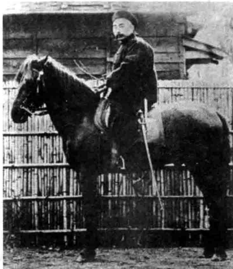
图1-4 端方(1861~1911)满洲人,清末大臣,金石学家;热爱艺术,对西方先进技术有浓郁兴趣。曾任员外郎、湖广、两江总督等职,宣统元年(1909)起为川汉、粤汉铁路督办,镇压保路运动时被杀。为清末出洋考察宪政五大臣之一,回国后带回了放映机、照相机等西方技术产品。

但在民间,放映活动并未停止。如在北京前门外的大栅栏,由任庆泰开设的大观楼戏院仍在进行电影放映。除此之外,西单市场内的文明茶园、东安市场内的吉祥戏院、西城新丰市场里的和声戏院,相继都有电影放映。