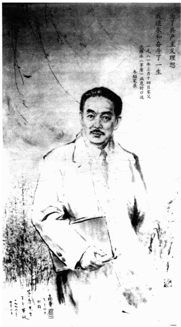
高莽为茅盾作的画像