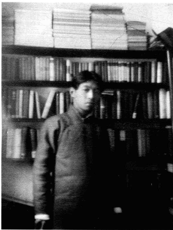
一九二五年摄于上海