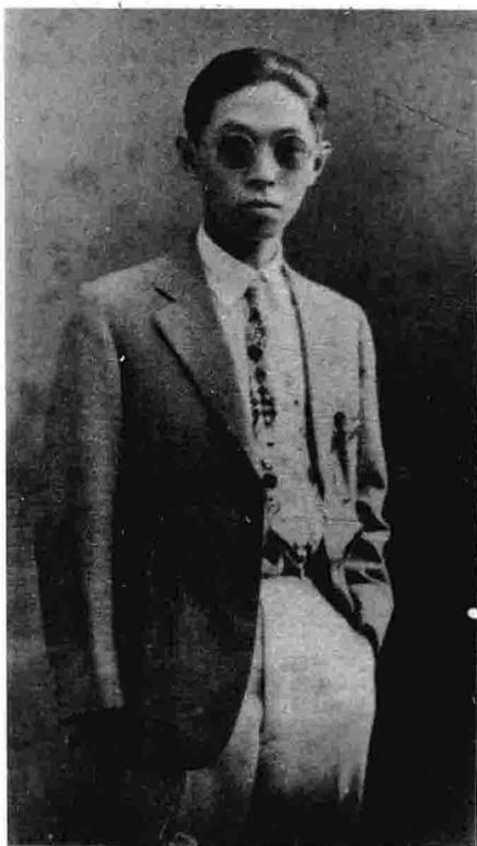
一九二七年摄于汉口