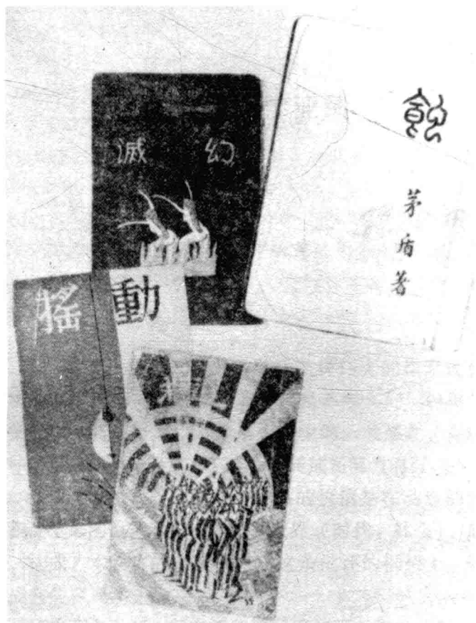
《蚀》及《幻灭》、《动摇》、《追求》初版本书影