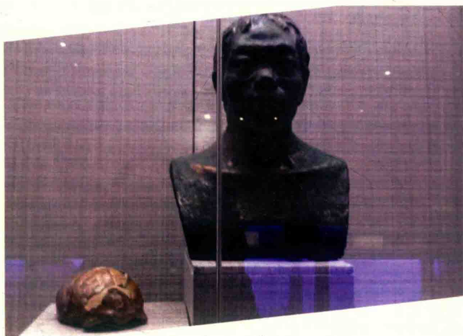
圖 1-2 雲南紅河地區出土的「蒙自人」頭骨及復原像

雲南存在著遠古人類的遺跡。雲南地區在二十世紀六十年代發現的「元謀猿人」、「麗江人」、「西疇人」、以及 2009 年在昭通發掘的距今 600 萬年的古猿頭骨，都說明雲南與中國國內其它地區一樣，從遠古以來就一直有人類居住。有人類就有勞動、生息、繁衍。而在雲南省境內，舊石器時代直至新石器時代的文化遺址都有連續性，有路南（今石林縣）舊石器時代遺址、蒙