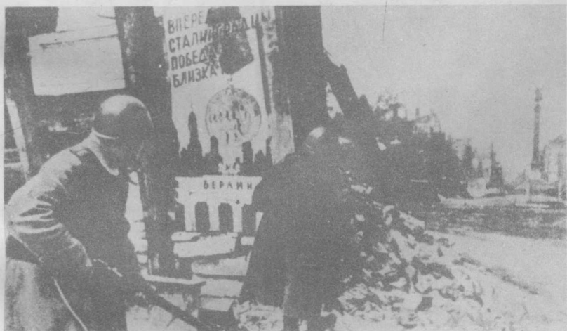
斯大林格勒人进抵柏林!