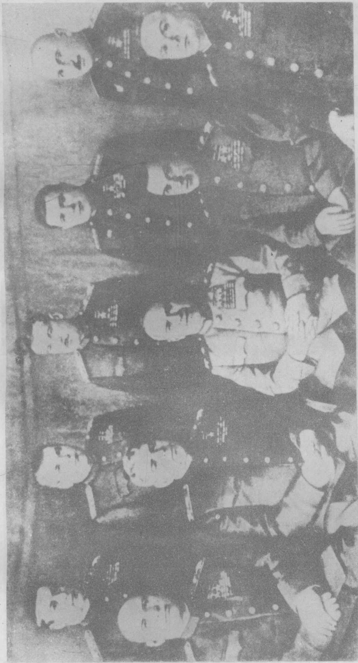
伟大卫国战争最后阶段各方面军司令。前排自左至右：苏联元帅И.С.科涅夫、А.М.华西列夫斯基、Г.К.朱可夫、К.К.罗科索夫斯基、К.А.梅列茨科夫；后排：苏联元帅Ф.И.托尔布欣、Р.Я.马利诺夫斯基、Л.А.戈沃罗夫、大将А.И.叶廖缅科和И.Х.巴格拉米扬