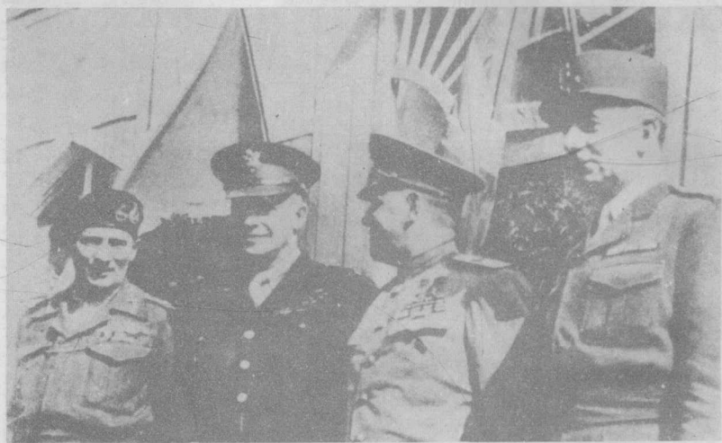
盟军的司令们(自左至右)蒙哥马利、艾森豪威尔、朱可夫、拉特尔·德·塔西尼在柏林