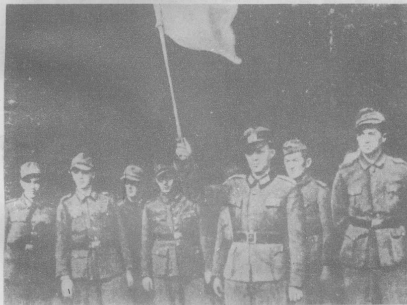
德军在波罗的海沿岸战线的—一个地段上投降