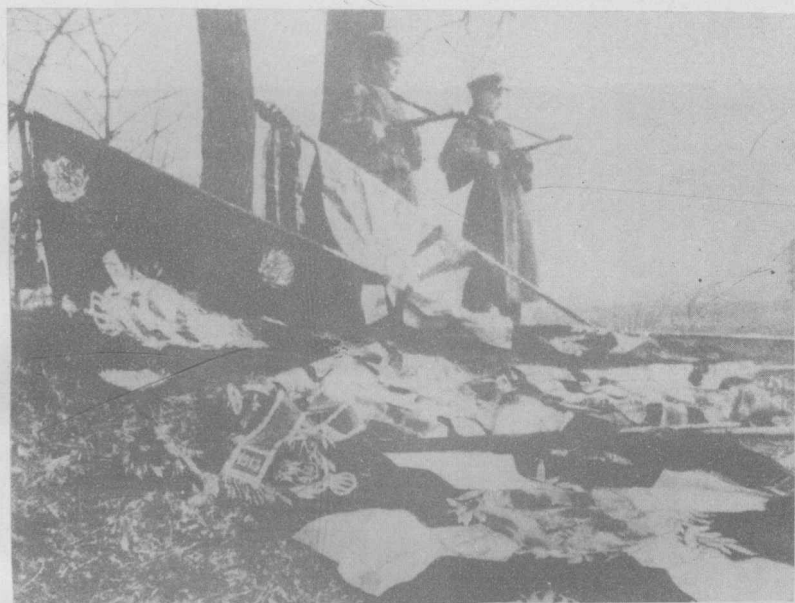
德国法西斯军队在苏德战线的—一个地段上投降时放下的战旗