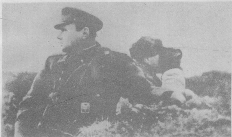
卡累利阿方面军司令K.A.梅列茨科夫大将在希尔内斯附近的观察所里