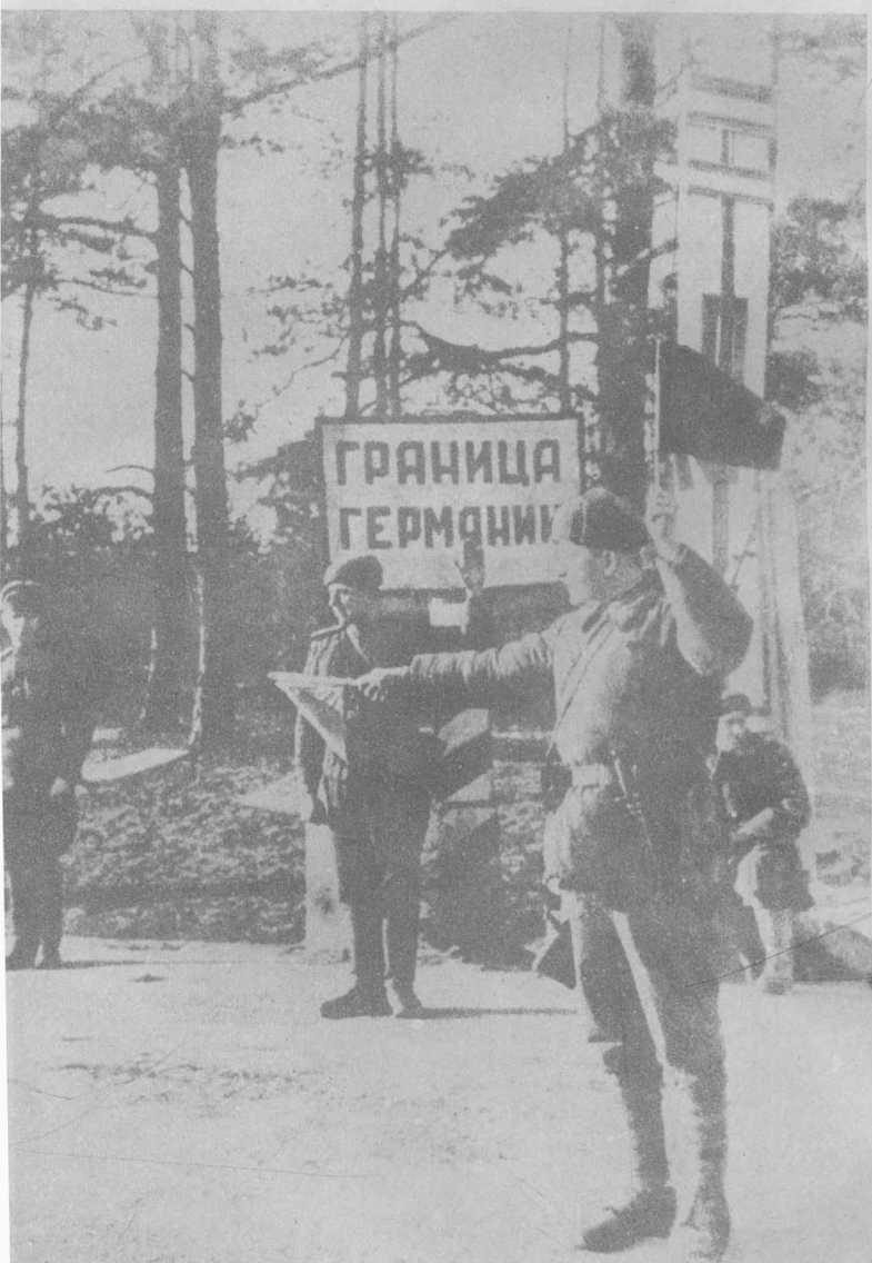
苏军在德国边境的检查站