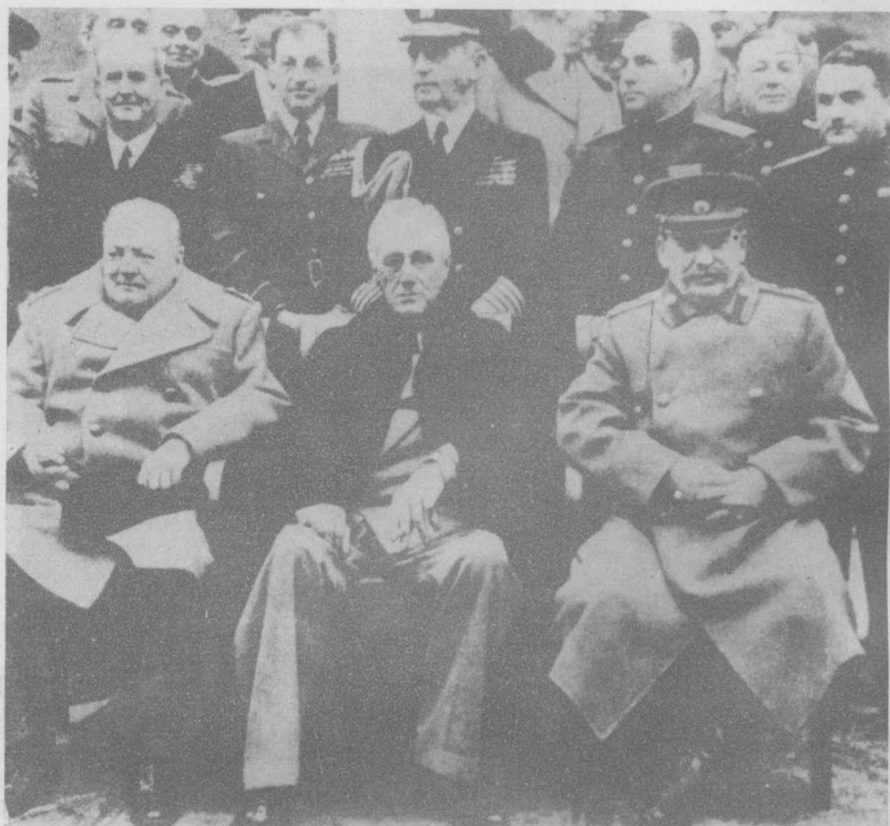
苏、美、英三国政府首脑在雅尔塔会议上