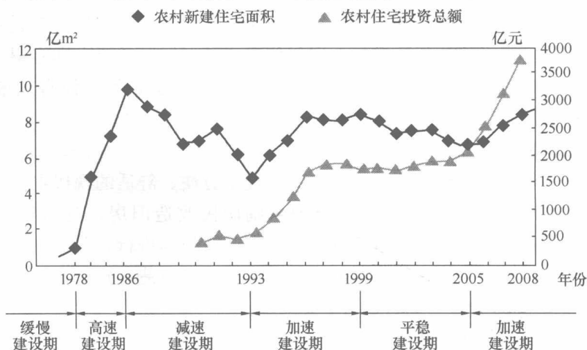
图 1.2 基于建设速度的我国农村住宅发展阶段

我国农村住宅建设发展的各个阶段，大致可如图 1.2 所示。改革开放以前，我国广大农村地区居民的经济收入低，住宅建设增长也较为缓慢。自 1978 年十一届三中全会召开后，农村经济得到了迅速恢复和发展，农村面貌发生了翻天覆地的变化。随着农民收入的逐年提高，住宅建设的规模不断扩大，新建住宅面积由 1978 年的约 1 亿 m^2 攀升至 1986 年的近 10 亿 m^2 ，形成一个高速建设期。此后，由于大部分农民的住房问题已基本得到解决，因此农村住宅开始进入改善和改造工程，建设速度呈下降趋势，至 1993 年，我国农村新增住宅面积约为 5 亿 m^2 。1993 年开始，农村建设得到了国家的重视，吸纳了大量农村剩余劳动力，使农民收入再次显著提高，居住条件得到了很大改善，农村住宅建设也进入了第二个高潮期，其建设总量和资金投入量保持着平稳的增长态势。新建住宅面积一路攀升至 1999 年的 8.34 亿 m^2 ，住宅投资由 1993 年的 760 亿元增至 1999 年的 1799 亿元。进入 21 世纪以后，我国加强了城镇化和新农村建设的力度，农村住宅建设保持平稳增长。2000~2005 年，年均新建住宅面积保持约 7 亿 m^2 ，年均住宅投资 1903 亿元，2008 年更是达到了 3547 亿元。随着新建和改建的农村住宅逐年增多，全国农村人均住宅建筑面积也在逐年递增（如图 1.3 所示），截至 2008 年底已达到 32.4 m^2 。