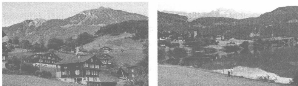
图 1.1 欧洲典型的“生态村”

社区集中居住区内实现农业生产活动与生活分开，集中居住区周边的农业户仍然保留农业生产活动与居住一体的传统方式；100%的农村社区建设了集中的雨水排放系统，住户自备了家庭化粪池和污水处理系统，使用卫生厕所，粪便由市政当局集中处理；100%的农村社区生活垃圾由市政当局集中收集和处理……”。图 1.1 分别为欧洲典型的依坡而建、湖光山色“生态村”。