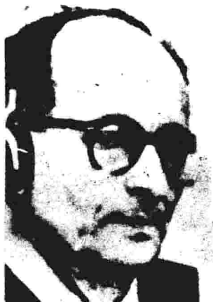
前纳粹刽子手阿道夫·艾希曼