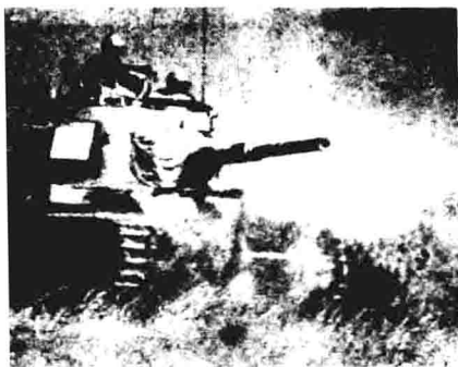
埃及坦克与以军展开夜战