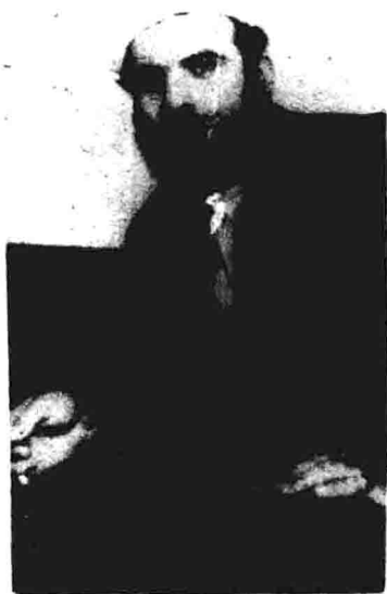
被“摩萨德”绑架的真主党首领奥培德