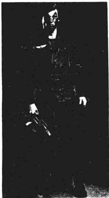
以色列特种作战部队士兵