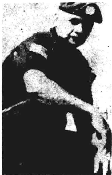
遭绑架的美国海军中校希金斯（后被处死）