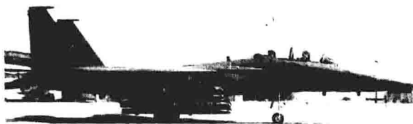
轰炸伊拉克核反应堆的以色列F—15战斗轰炸机