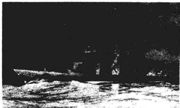
埃及导弹攻击以驱逐舰“埃拉特”号