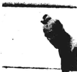
潜入奥运村的“黑九月”恐怖分子