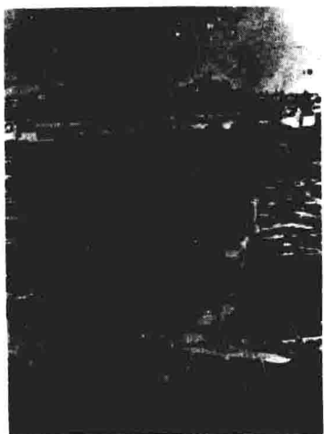
“十月战争”中，以军特种部队偷渡苏伊士运河