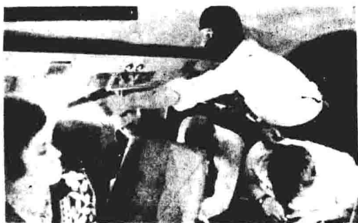
劫机者持枪威逼法航139 航班乘客