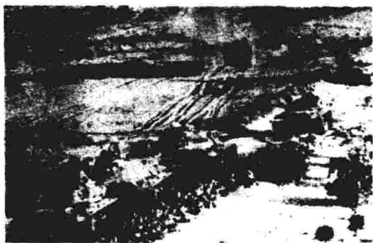
“六日战争”中以色列坦克集群入侵西奈