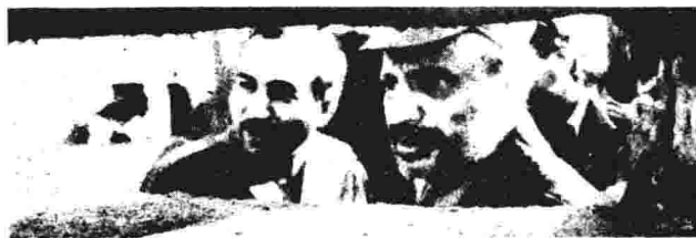
杰哈德和阿拉法特在贝鲁特指挥作战