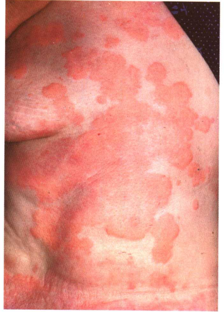
图 6-3 急性荨麻疹