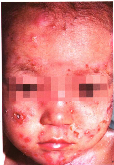
图 2-1 脓疱疮