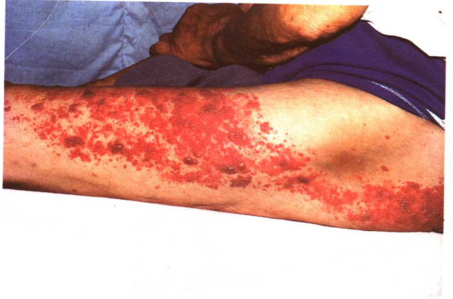
图 1-1 带状疱疹