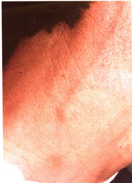
图 2-2 未定类麻风 耳神经粗大