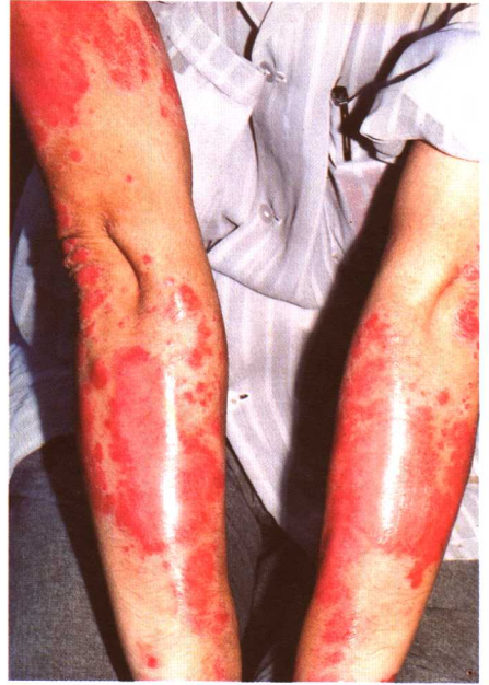
图 9-1 寻常型银屑病