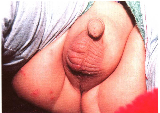
图 4-1 疥疮 阴囊结节