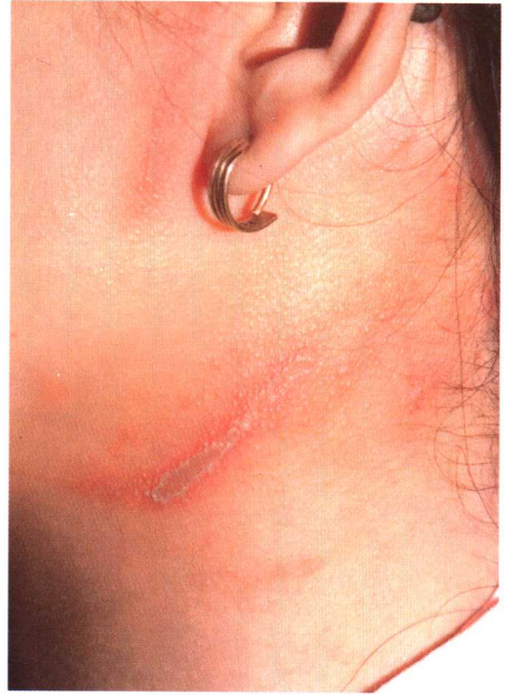
图 4-3 隐翅虫皮炎