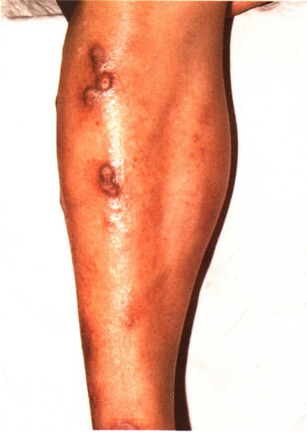
图 8-2 结节性痒疹