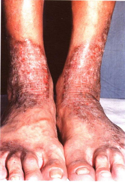
图 6-2 慢性湿疹