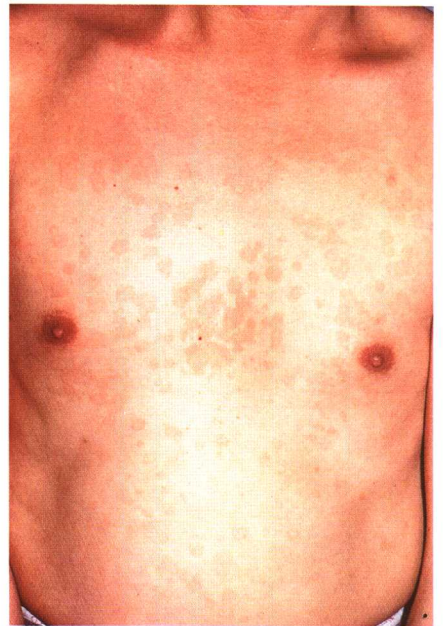
图 3-5 花斑癣