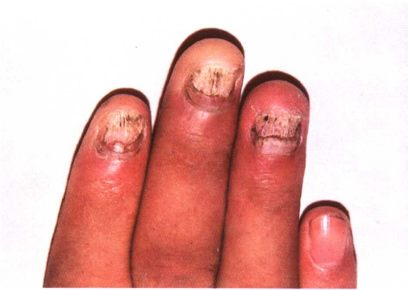
图 3-4 甲真菌病