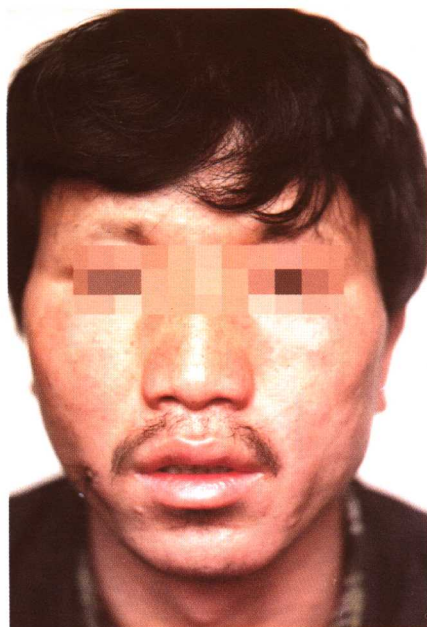
图 2-4 瘤型麻风 面部结节和斑块