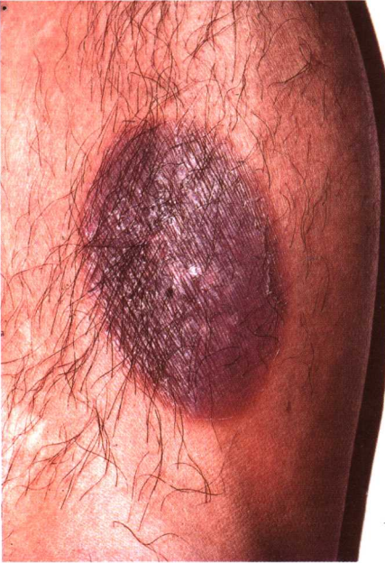
图 6-6 固定性药疹