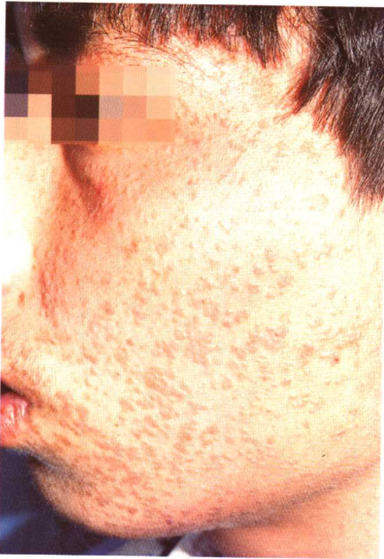
图 1-2 扁平疣