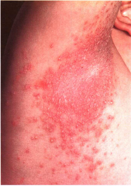
图 3-6 皮肤念珠菌病