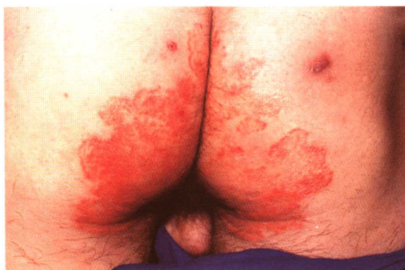
图 3-2 股癣