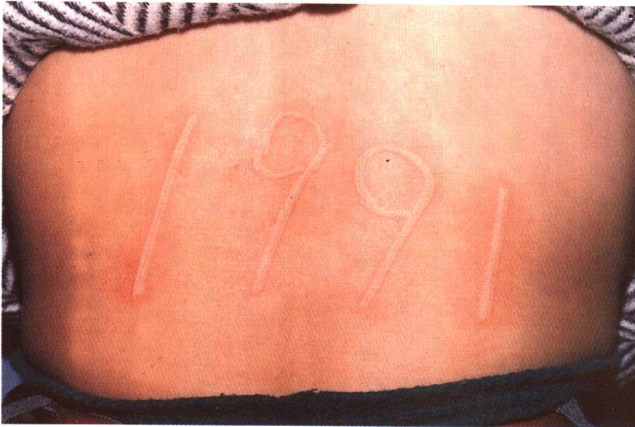
图 6-4 皮肤划痕症