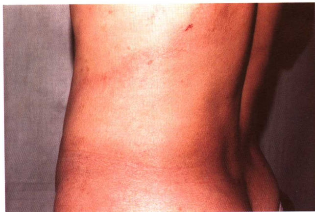
图 2-3 结核样型麻风