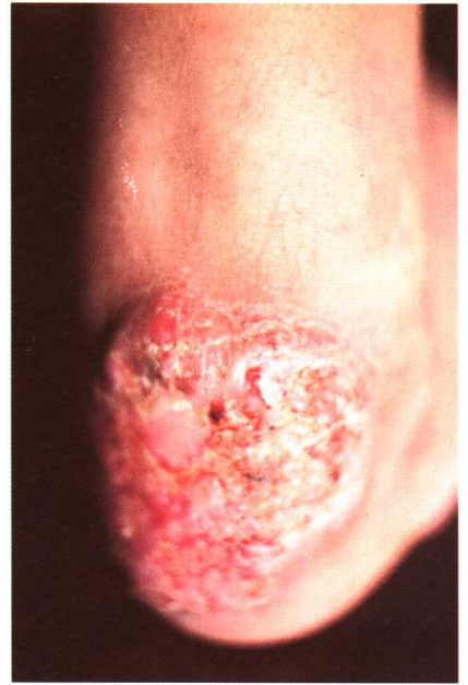
图 3-7 着色芽生菌病