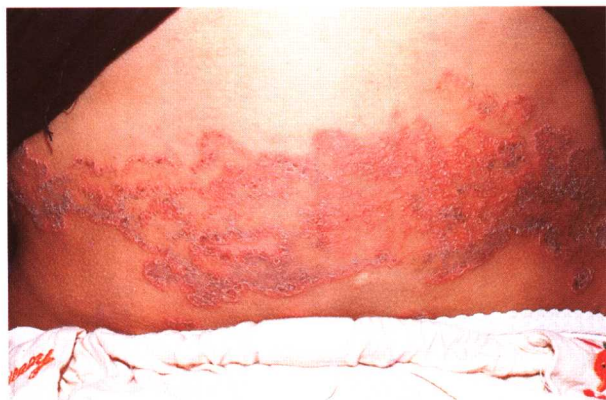
图 3-1 体癣