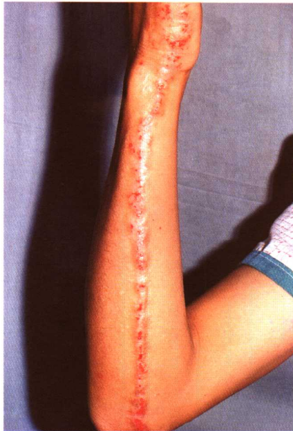
图 9-2 线状扁平苔藓