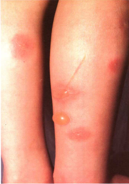
图 6-5 丘疹性荨麻疹