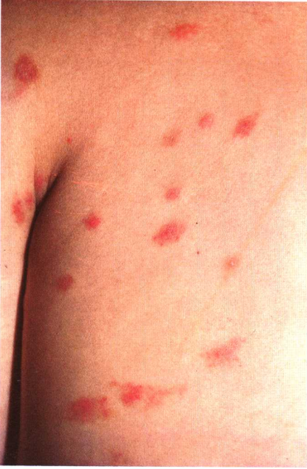
图 4-2 螨皮炎