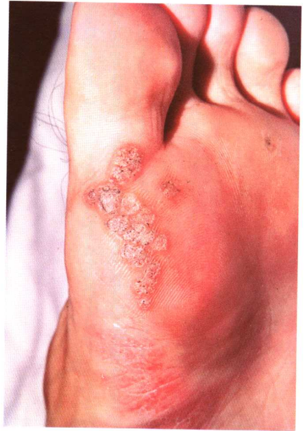
图 1-3 跖疣