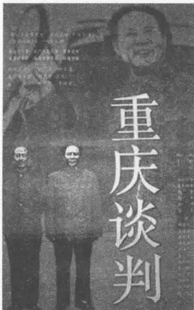
◎《重庆谈判》电影海报

年8月28日飞抵重庆，与国民党进行谈判。谈判进行了43天，蒋介石被迫承认中国共产党提出的和平建国的基本方针，统一召开有各党派代表及社会贤达参加的政治协商会议。但在解放区政权和军队等根本问题上，尽管中国共产党多次作出让步，蒋介石仍坚持所谓军令政令“统一”，以致双方在这些问题上未能达成一致。10月10日签订《政府与中共代表会谈纪要》——即《双十协定》，11日毛泽东返回延安，周恩来、王若飞仍留重庆继续与国民党代表商谈。