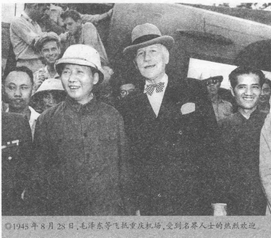
◎1945年8月28日,毛泽东等飞抵重庆机场,受到名界人士的热烈欢迎。