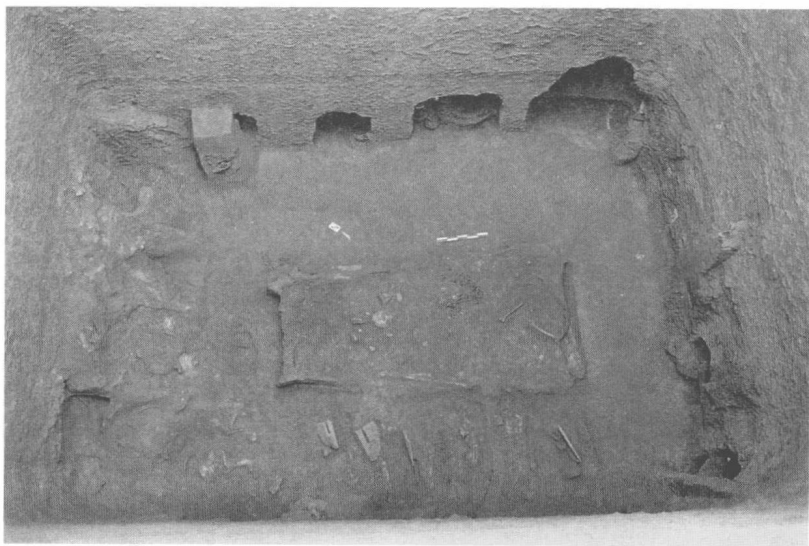
极尽考究的陶寺大墓，墓室与壁龛内遍布各类随葬品