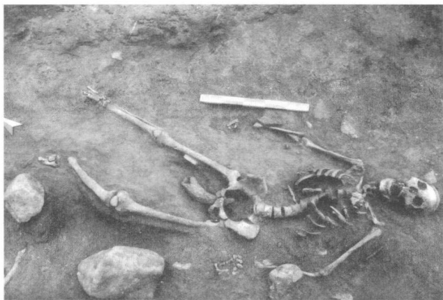
阴部被插入牛角的 受害女性