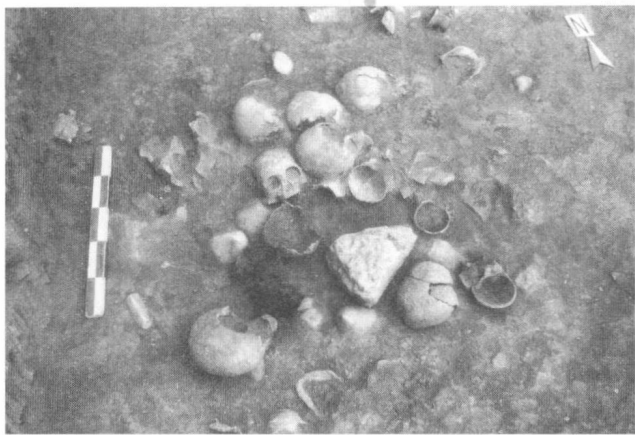
被砍切下的人头骨