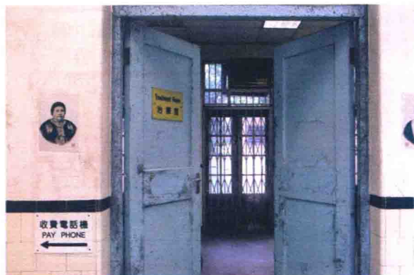
發展局建議非牟利機構把何東夫人醫局 活化為社會服務或教育中心