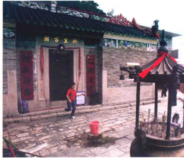
滘西洲洪聖古廟是少數被列為法定古蹟的離島廟宇

屯門的前達德學院主樓、元朗下白泥的碉樓以及蓮麻坑的葉定仕故居（均是法定古蹟），亦長期空置而未定出新的用途。前二者沒有對外開放，葉定仕故居雖然公開展示，但蓮麻坑位處邊境禁區，目前只許持有禁區紙的人進入，外界要等到二〇一五年該區解禁後才有機會踏足。