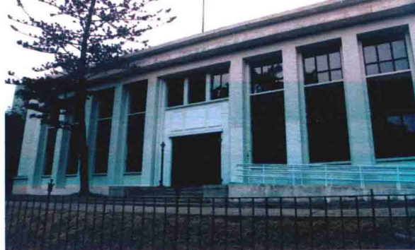
香港青年協會獲選在前粉嶺裁判法院 開設青年領袖發展中心