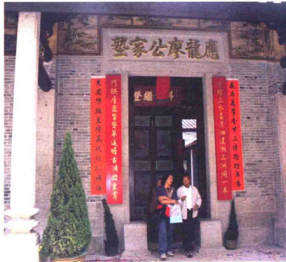
由上水鄉廖族出資、古蹟辦協助修葺的應龍廖公家塾

聯合國教科文組織在二〇〇〇年設立「亞太區文物古蹟保護獎」（UNESCO Asia-Pacific Awards for Cultural Heritage Conservation），吸引不少地區提交文物保育項目參選，當中包括香港。直至二〇一三年底，香港共有十四幢建築物獲獎（見表二），位於新界及離島區的有西貢滘西洲洪聖古廟、大埔敬羅家塾、西貢鹽田梓聖若瑟小堂、上水應龍廖公家塾和舊大澳警署。獲獎原因除了令建築物回復昔日面貌外，最重要是注入生氣，令建築物延續生命。