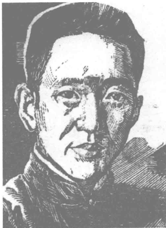
陈布雷木刻像，系1940年其九妹陈玲娟所刻