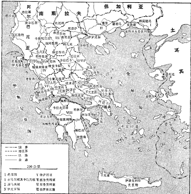
图 28 现代希腊