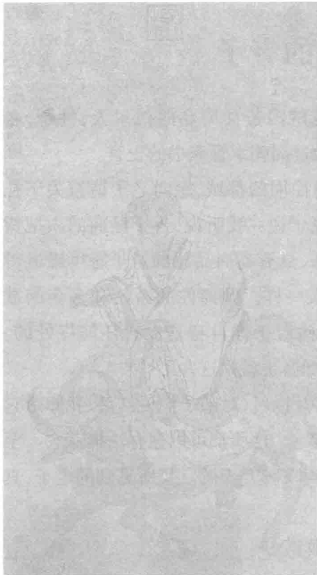
【明】张路《老子骑牛图》