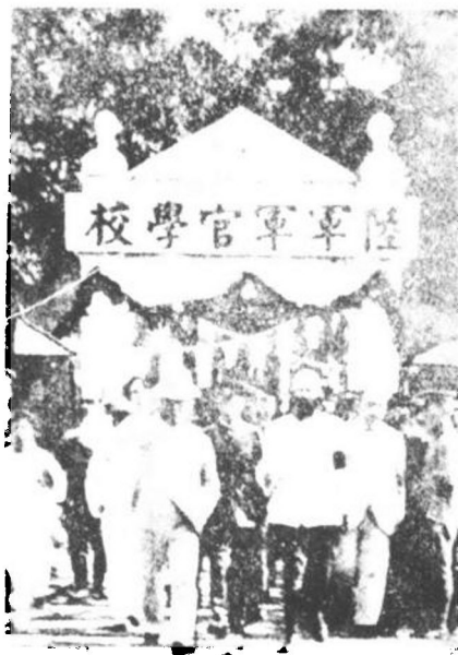
► 1924年，國共合作，孫中山在廣州黃埔一手創立的陸軍軍官學校（簡稱黃埔軍校。）

自嘆不如！事實上，早年畢業於黃埔前四期的革命將領，他們歷經東征、北伐、國共內戰、抗戰、以至解放戰事（台灣名爲「戡亂」）、台灣海峽戰事等戰役的洗鍊，最後能竄升至上將者，平均每期畢業的學生中，也不過是三、四人而已。故其憑戰功晉升的成果，可謂是「得來不易」。反之，黃埔十六期的學生則不然，他們於民國二十九年（1940年）畢業後，至多僅經歷抗戰與內戰戰役的洗禮，並無多大的戰功。於國府遷台後，蔣仲苓等人的位階最高者也只不過是少校連長而已。「八·二三砲戰」期間，他們雖然已晉升至營長，但位階甚低，對戰局發展，亦無實質的助益