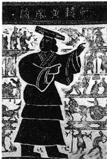
轩辕黄帝像 嘉祥武氏墓群石刻

当神农氏的后裔榆罔时，住在中国地面的民族约分三大支：最北一支是荤粥 ① ，分布于今日的长城以北。最南一支是九黎 ② ，分布于长江流域。汉民族便介居在他们的中间，分布于黄河流域。这时的黄河流域——中原——最为肥沃，荤粥和九黎两族遥遥对峙着，都想侵占这块土地，以为己族发展的根据。汉民族实逼处此，怎能相安，于是种族战争以起，黄帝建国的企图便立时