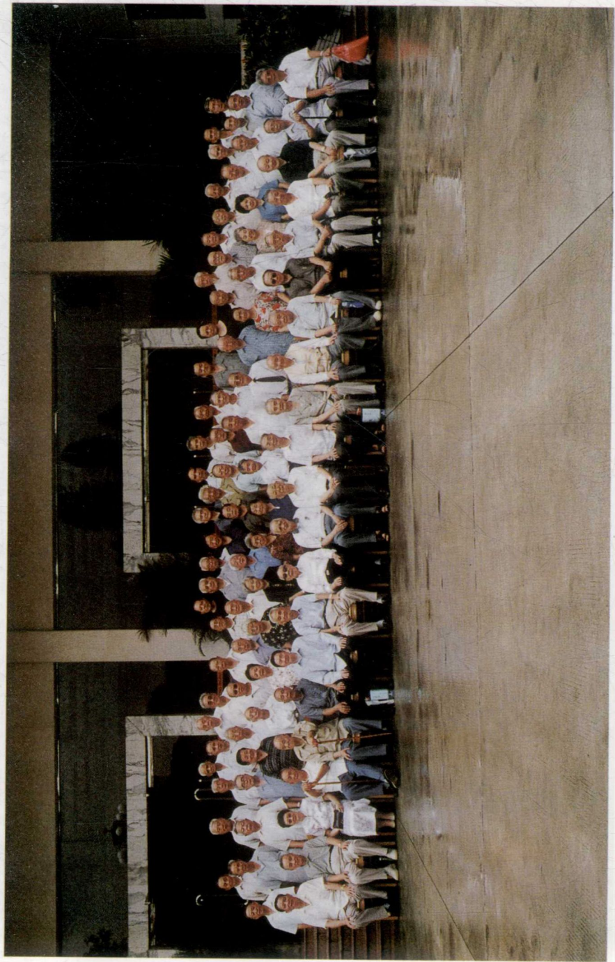
2002年8月20日，广州新四军研究会领导同志与第三师分会第七旅老战士合影（名单付后）