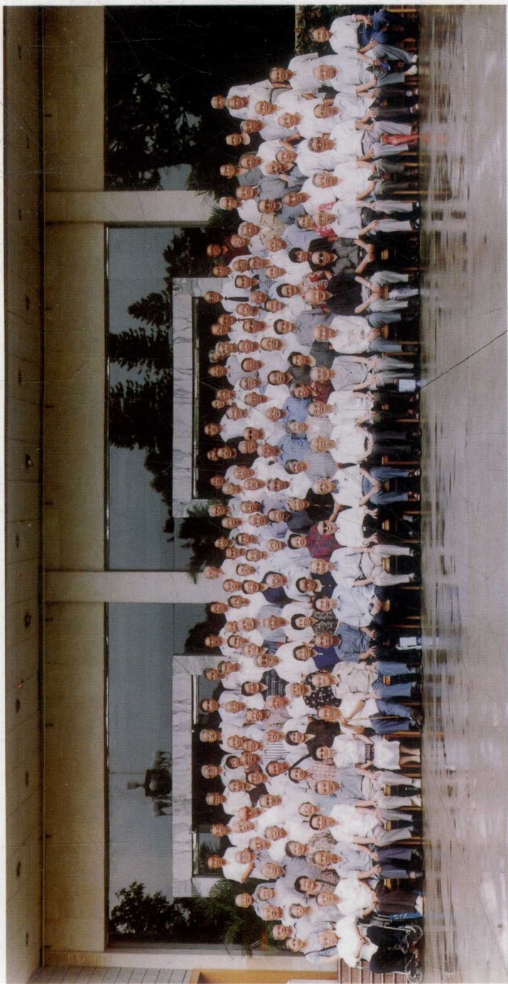
2002年8月20日，广州新四军研究会领导同志和第三师分会老战士合影（名单付后）