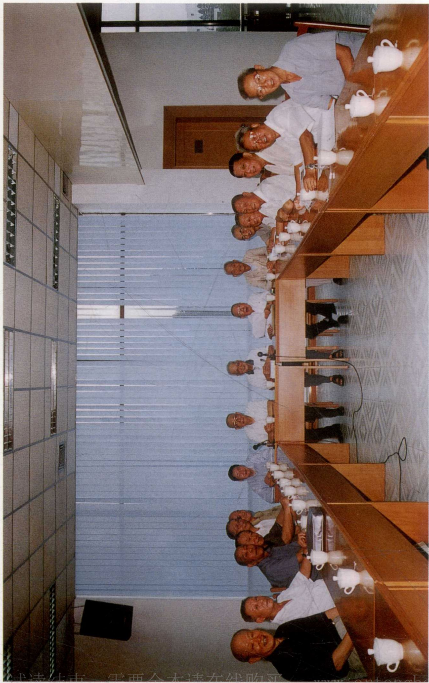
2002年8月20日，广州新四军研究会领导同志和《苏北抗日烽火》编委会在审查书稿