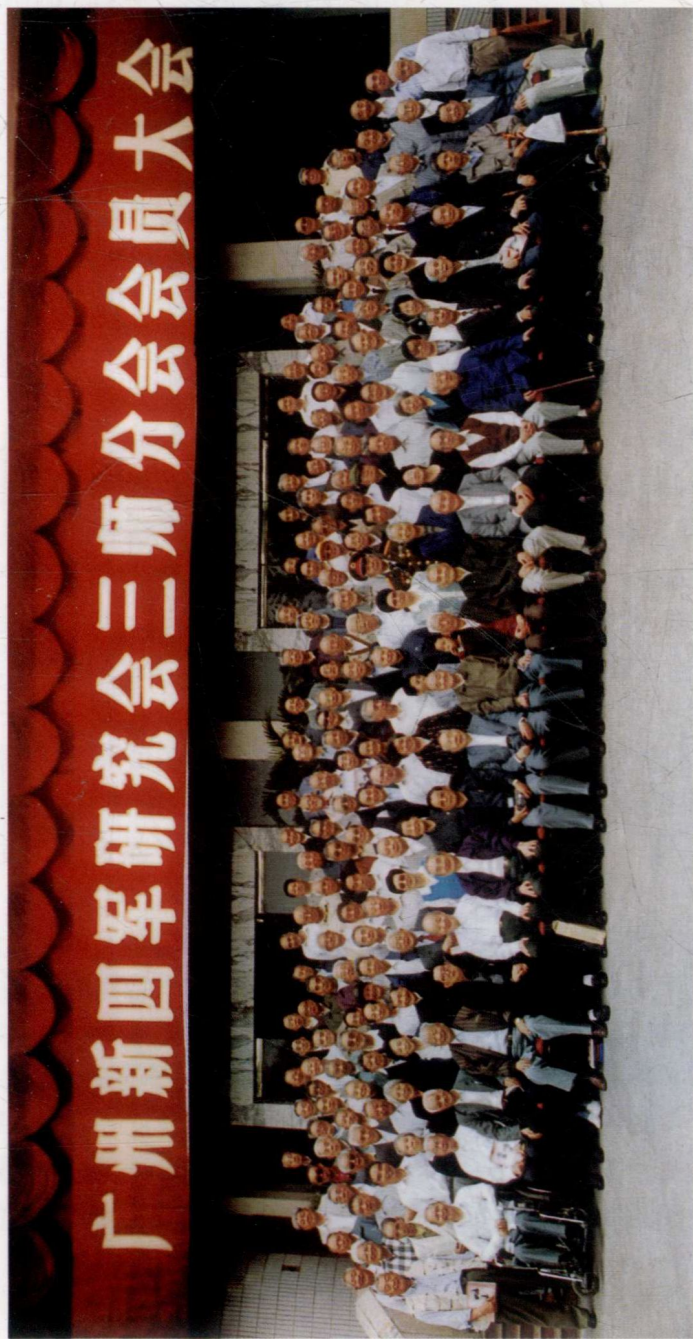
1999年3月6日广州新四军三师分会大会摄影