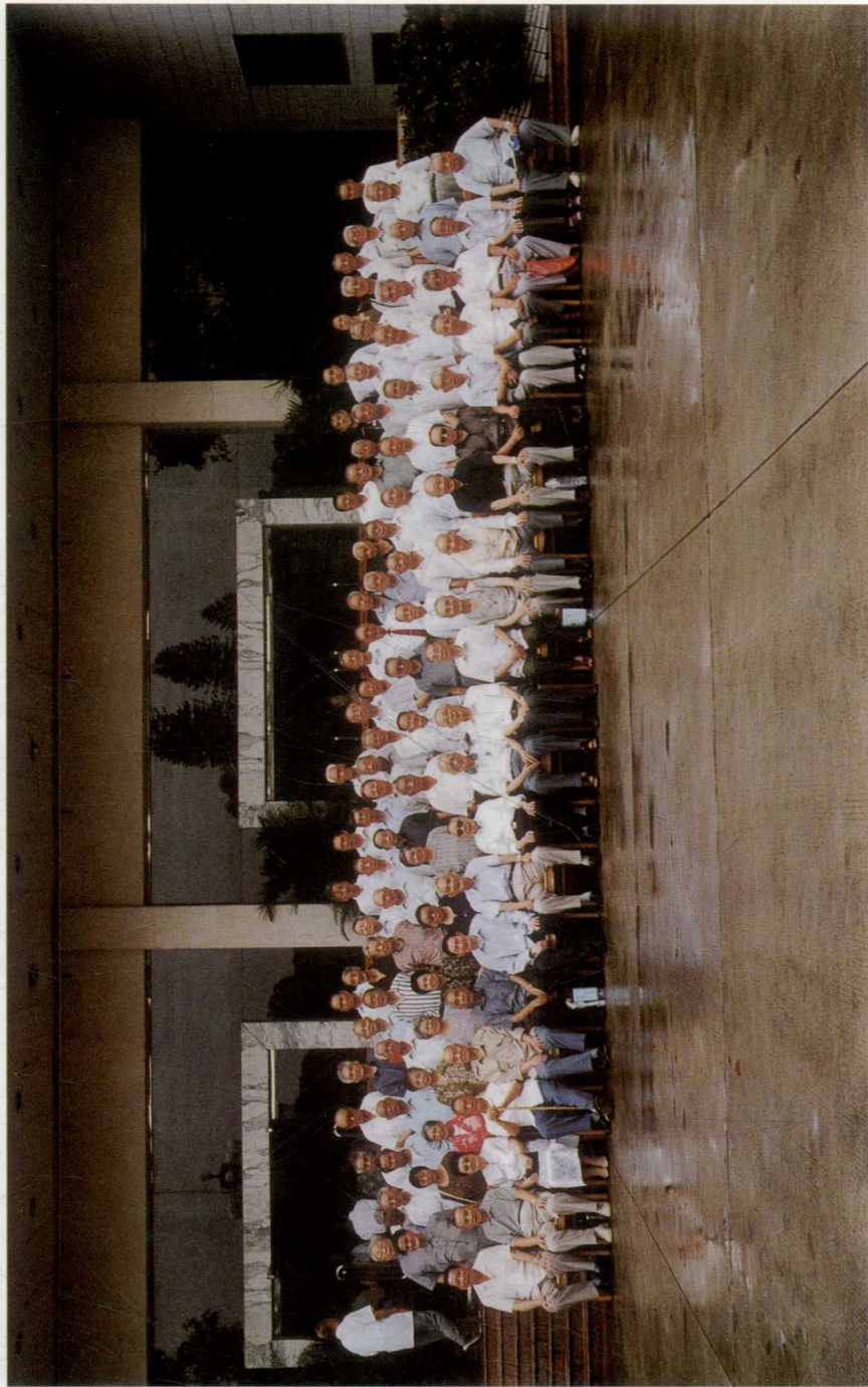
2002年8月20日，广州新四军研究会领导同志与第三师分会师部、八旅、十旅和独立旅老战士合影（名单付后）