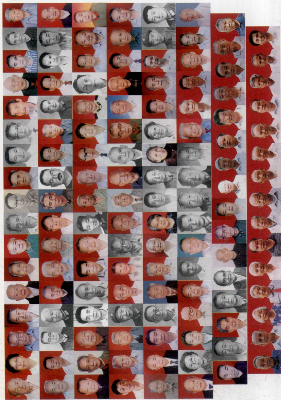
2002年8月20日，广州新四军研究会第三师分会老战士因外出或行动不便补照留影（名单付后）