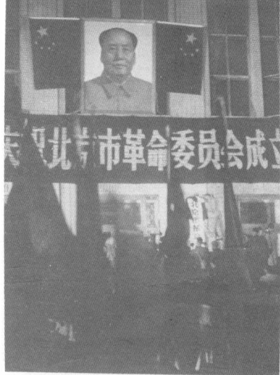
北京市革委會成立，市委大樓舉行掛牌儀式（一九六七年四月）