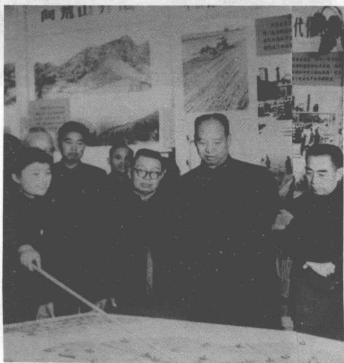
文革中第一個被打倒的「針插不進、水潑不進的北京獨立王國」市長彭真（右二）、二月逆流黑幹將「譚震林（右三）與周恩來（右一）」等「大躍進」期間在北京農展館參觀（一九五八年）