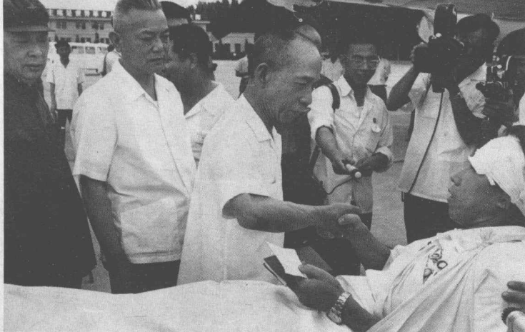
李富春、李先念、陳毅（右起）在機場迎接因在海外「宣傳毛澤東思想」而遭人毆傷的中國外交人員回國（一九六七年七月）