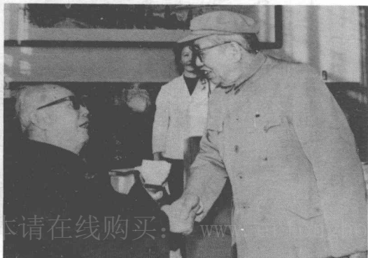
（左） （一九八一年） 文革後的譚震林（右）與葉劍英