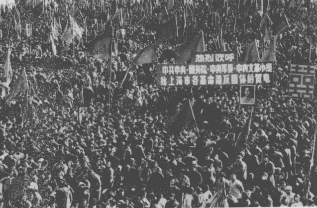
上海十餘萬民眾在人民廣場集會，慶祝中央支持上海造反（一九六七年一月）