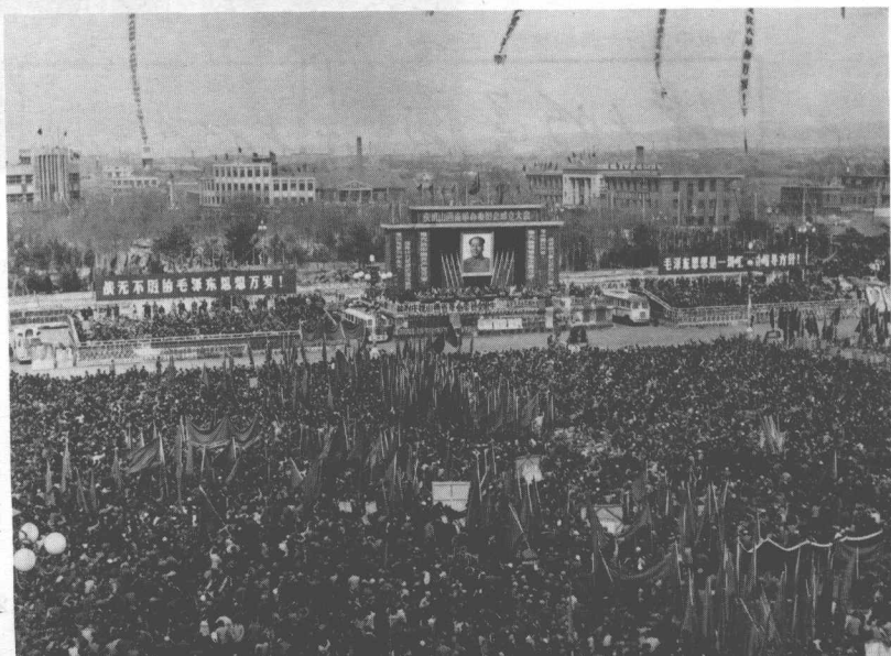
太原市三十萬人在五一廣場集會，慶祝山西省革委會成立（一九六七年三月）