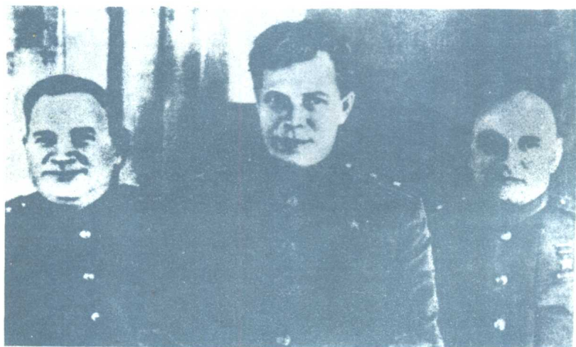
自左至右：红军后勤部长A.B.赫鲁摩夫、军械人民委员 Д.Ф.乌斯季诺夫、弹药人民委员B.Л.万尼科夫