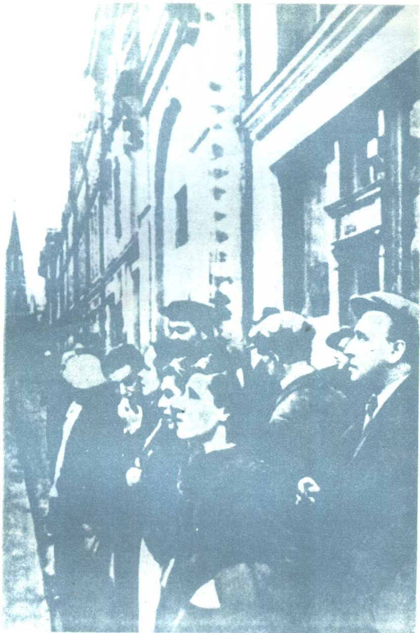
莫斯科人民在倾听苏联政府就法西斯德国背信弃义发动进攻发表声明（1941年6月22日）