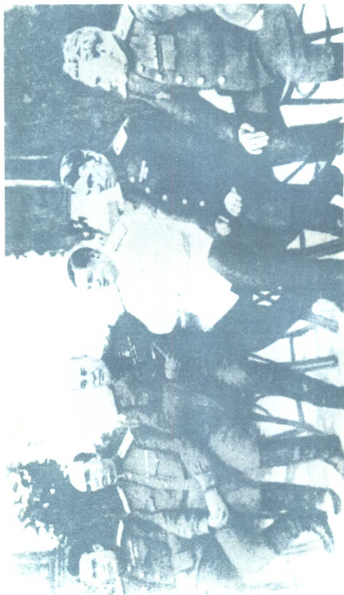
雅西—基什尼奥夫战役前。自左至右：М.Н.沙罗欣、И.Г.什列明、С.К.铁木辛哥、 Ф.И.托尔布欣、Н.А.加根、Н.Э.别尔札林（1944年8月）