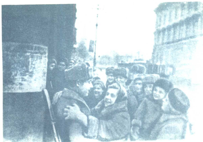
列宁格勒人感谢苏军解除了敌人的封锁（1944年1月27日）