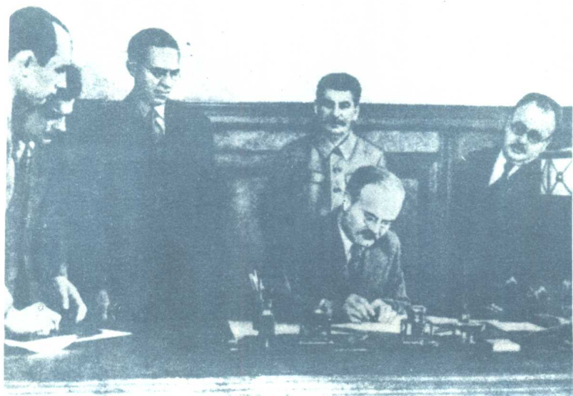
苏英两国政府签署对德联合作战协定（1941年7月12日）