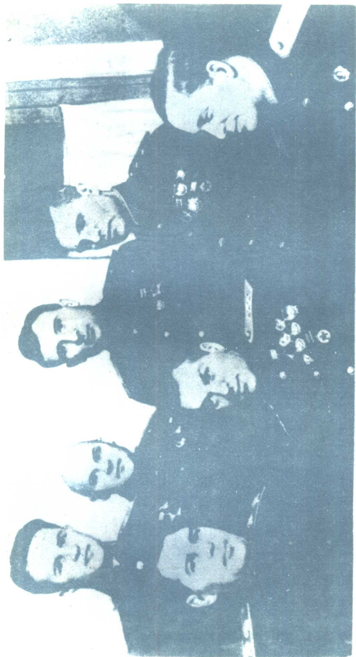
自左至右：苏联元帅А.М.华西列夫斯基、上将К.К.罗科索夫斯基、中将И.Т.佩列瑟普金；后排： 中将С.И.鲁坚科、少将К.Ф.捷列金、少将Г.Н.奥摩尔、炮兵中将В.И.卡札科夫（1943年）