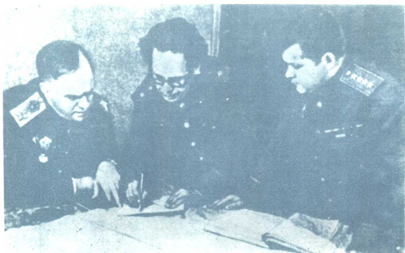
最高统帅部代表Г.К.朱可夫(左)、乌克兰第1方面军参谋长А.Н.博戈柳博夫(中)和方面军司令员Н.Ф.瓦杜丁(右)正在研究战役计划(1943年12月)