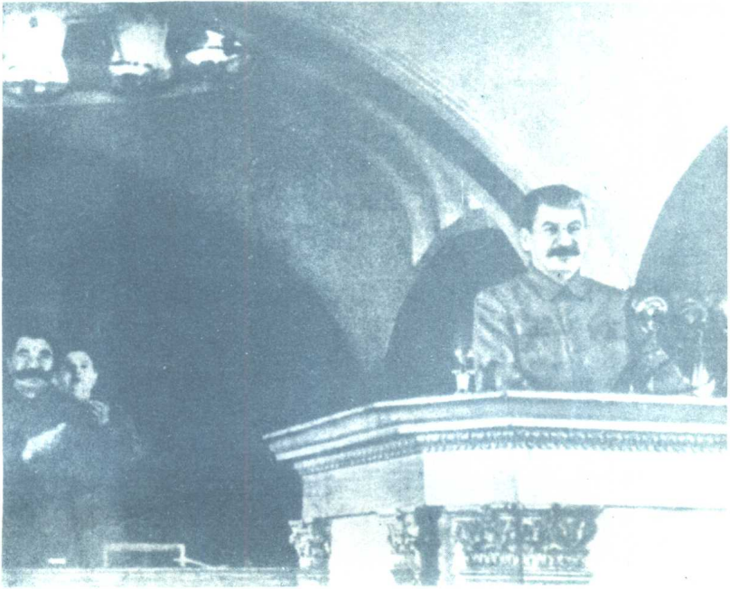
斯大林在伟大十月社会主义革命二十四周年庆祝大会上作报告（1941年11月6日莫斯科）