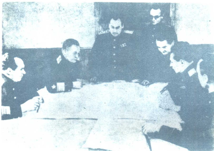
苏联军事代表团在雅尔塔（1945年）