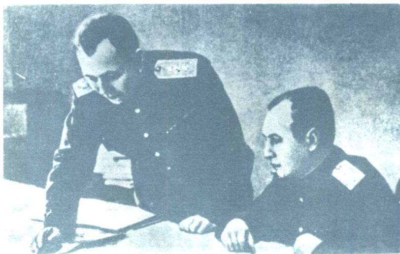
A. И. 安东诺夫（坐者）和С. М. 什捷缅科