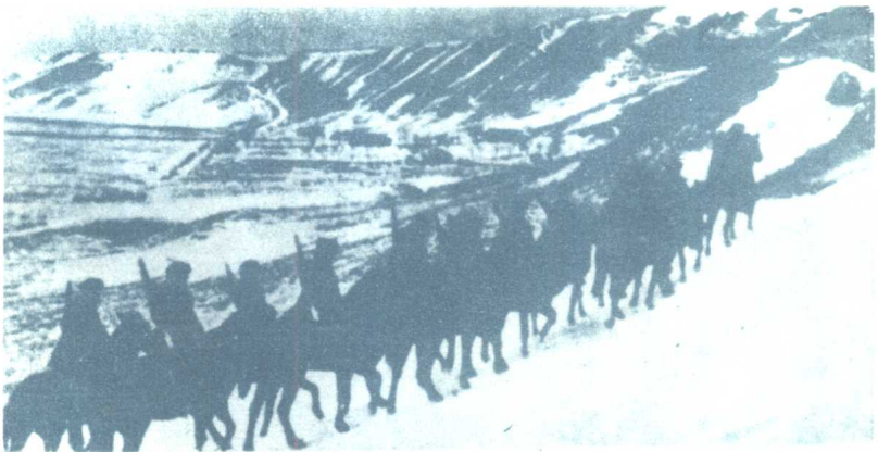
前往执行战斗任务。高加索方面军