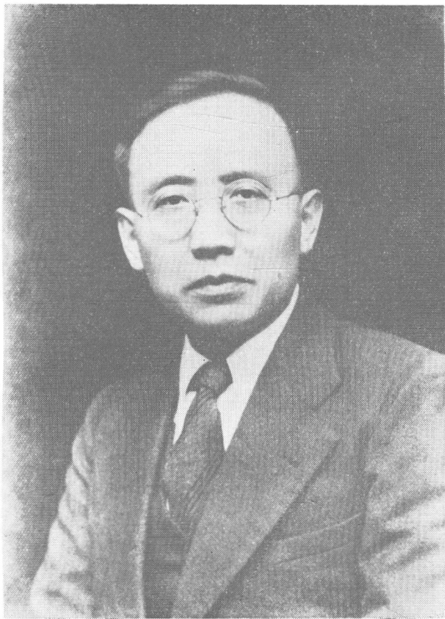
郭沫若 (1937年冬摄于广州)