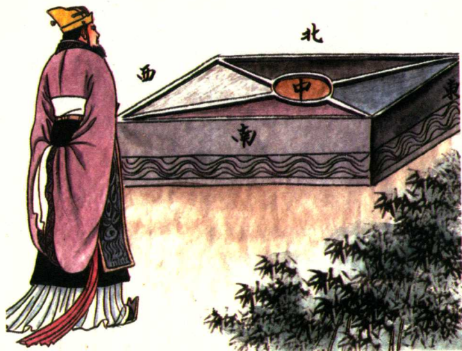
▲ 曰南北，曰西东。此四方，应乎中。

① 南北（西东）：方位名，指东、西、南、北四个方向。早晨太阳升起的方向是东方。② 此：这，代名词，这里代指东南西北四方。③ 应乎中：与中心相对应。应，对应；乎，于；中，中央、中心。