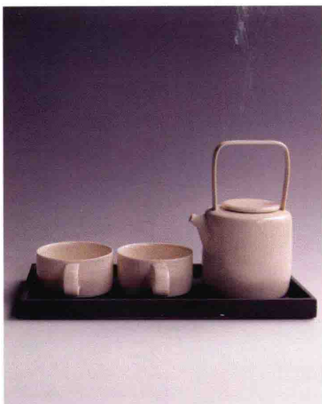
Derek Ilson (英国) 瓷茶具, 2009年10月 高度: 8.25英寸(21厘米) 宽度: 7英寸(18厘米) 长度: 13.5英寸(34厘米) 手工拉坯、挤压手柄、深灰色化妆土装饰的托盘