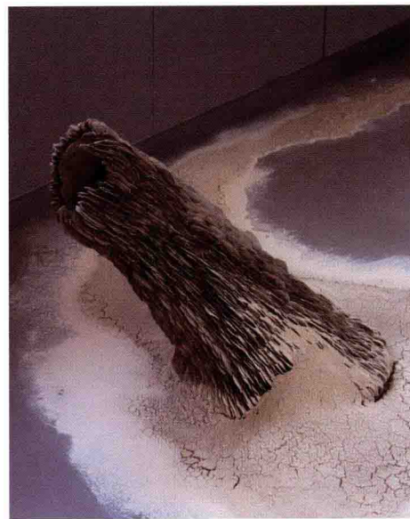
Phoebe Cummings (英国)