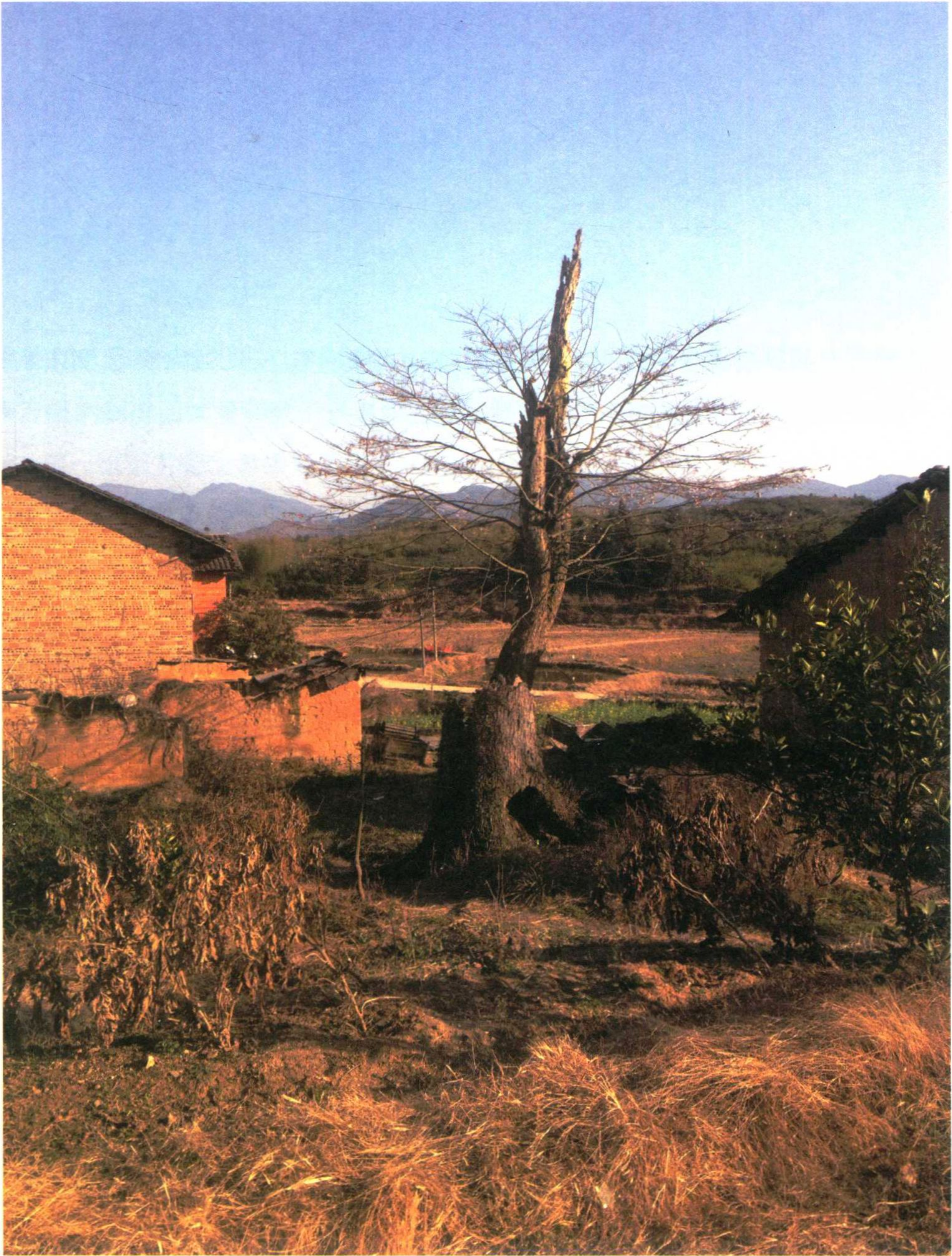
吾乡：我生活的地方