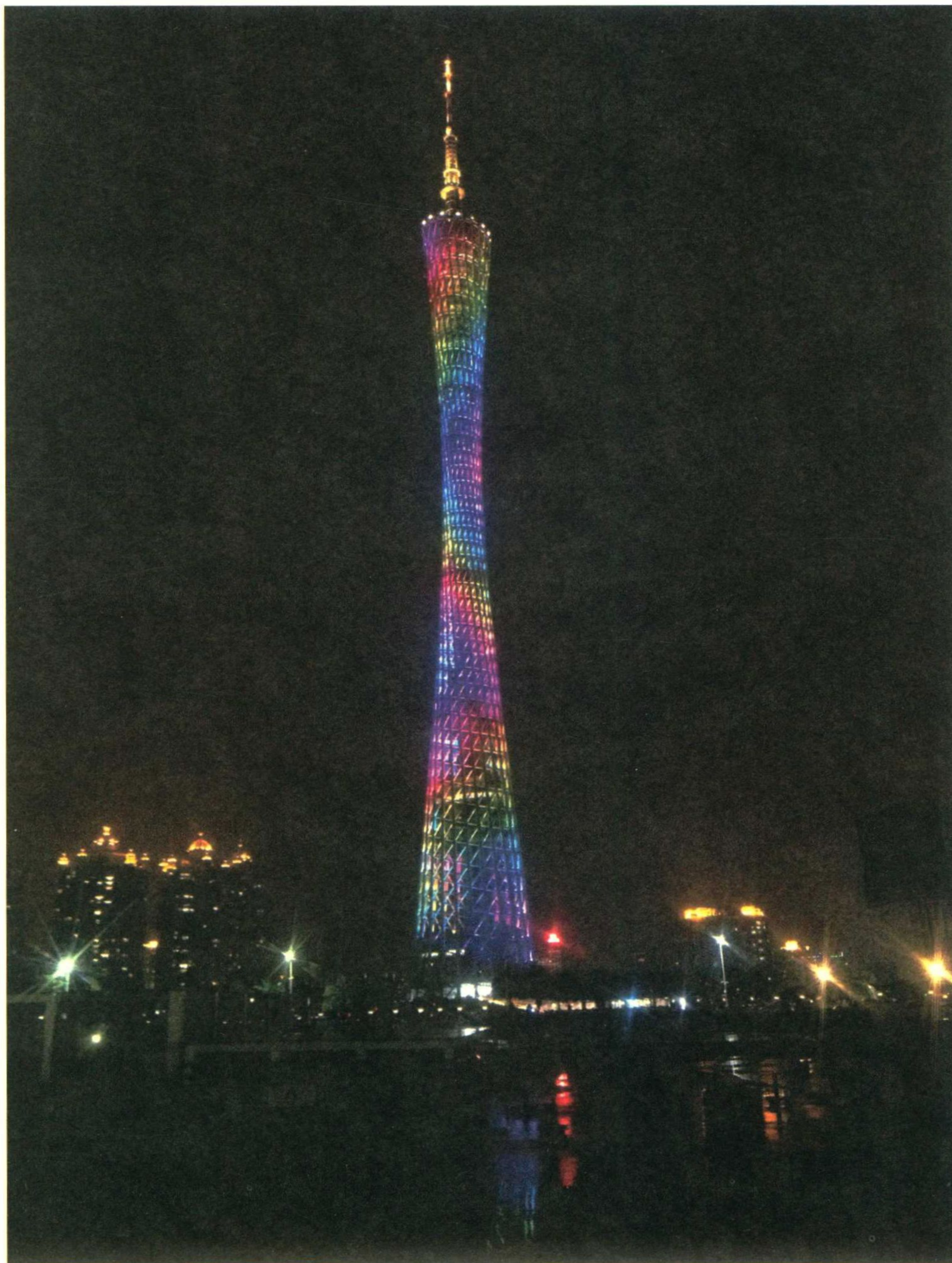
吾城：我生存的地方