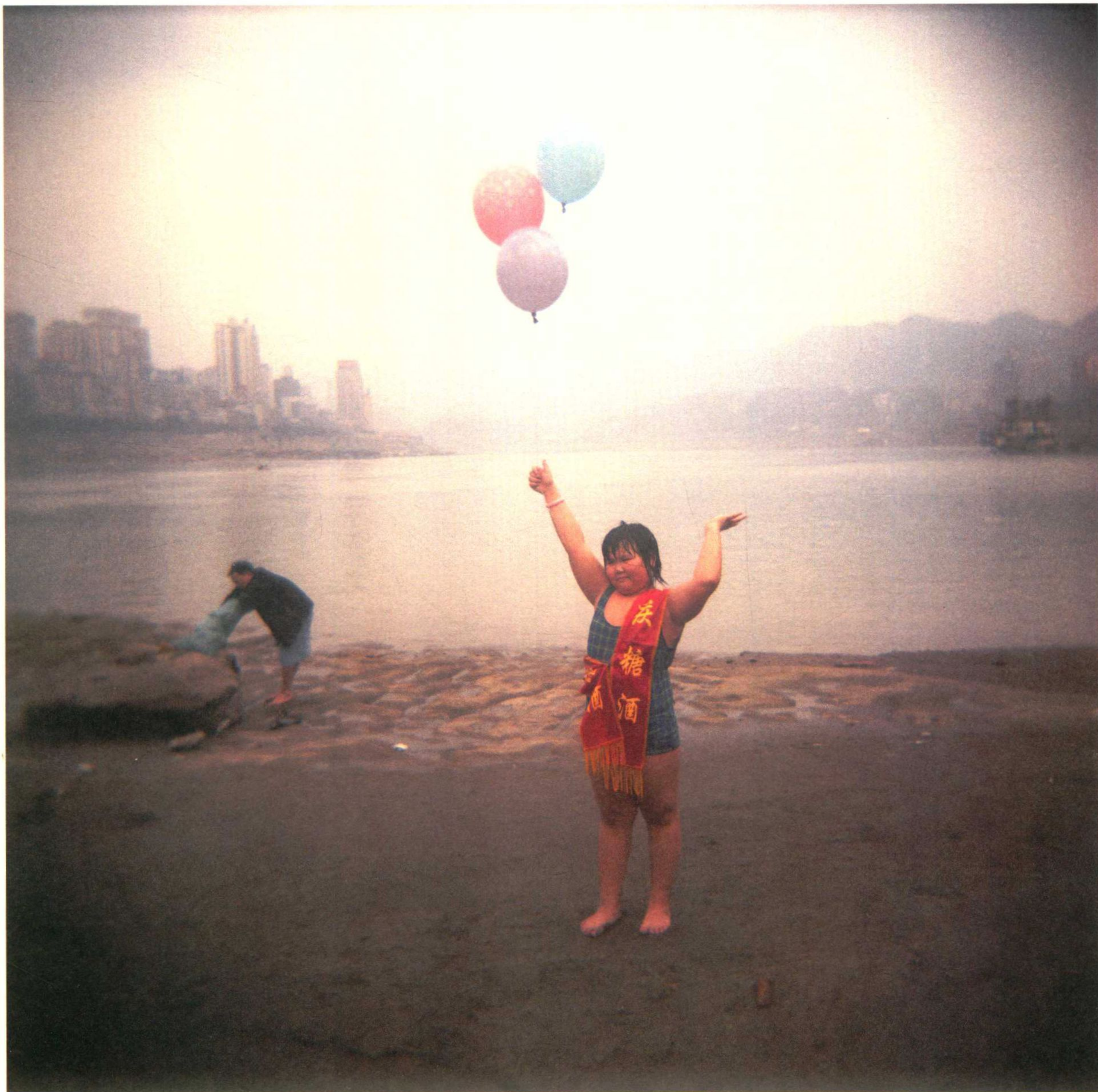
手拿气球庆祝自己成功横渡长江的小姑娘。2007年