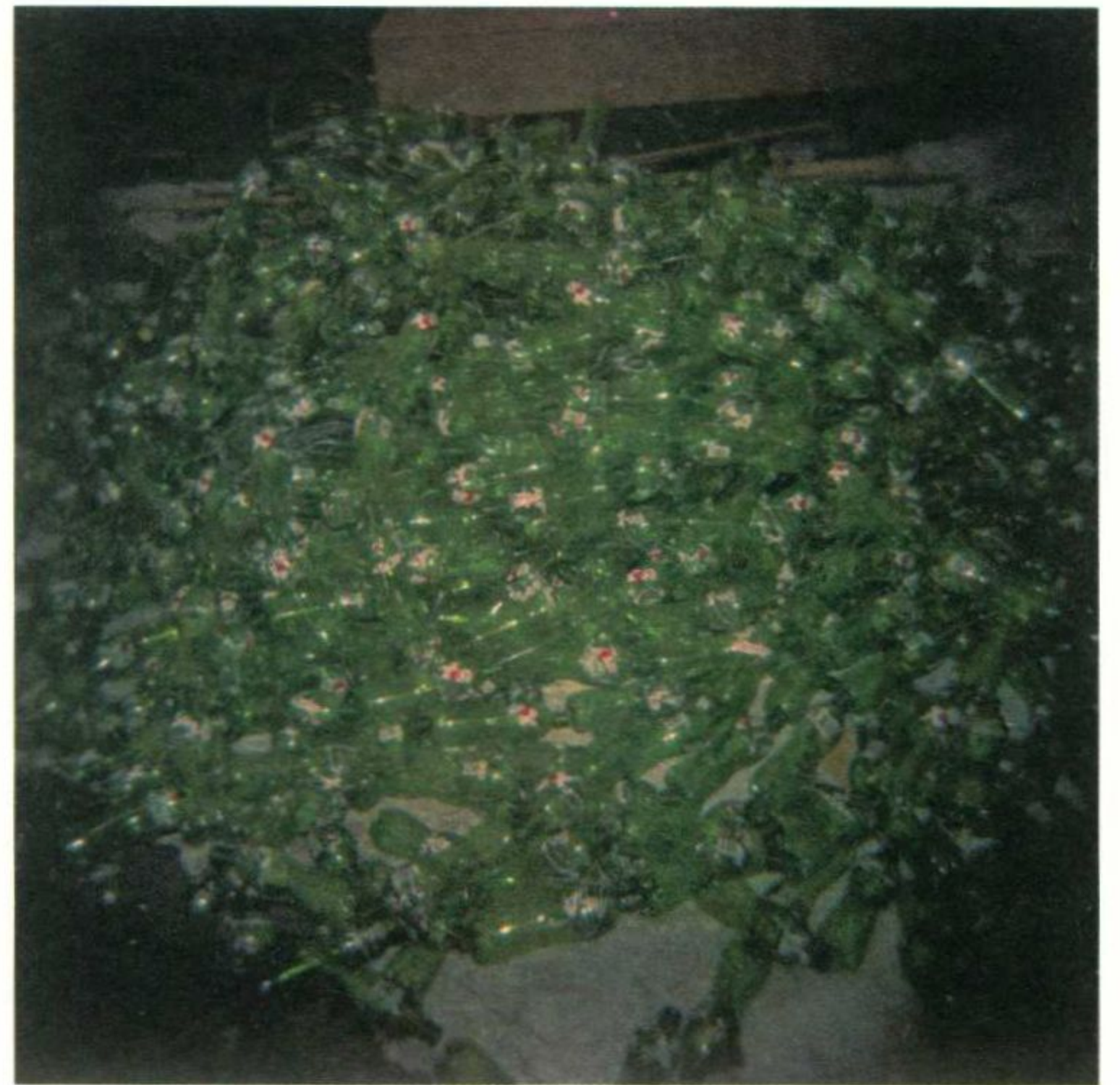
堆积在路边的绿色饮料瓶。2007 年