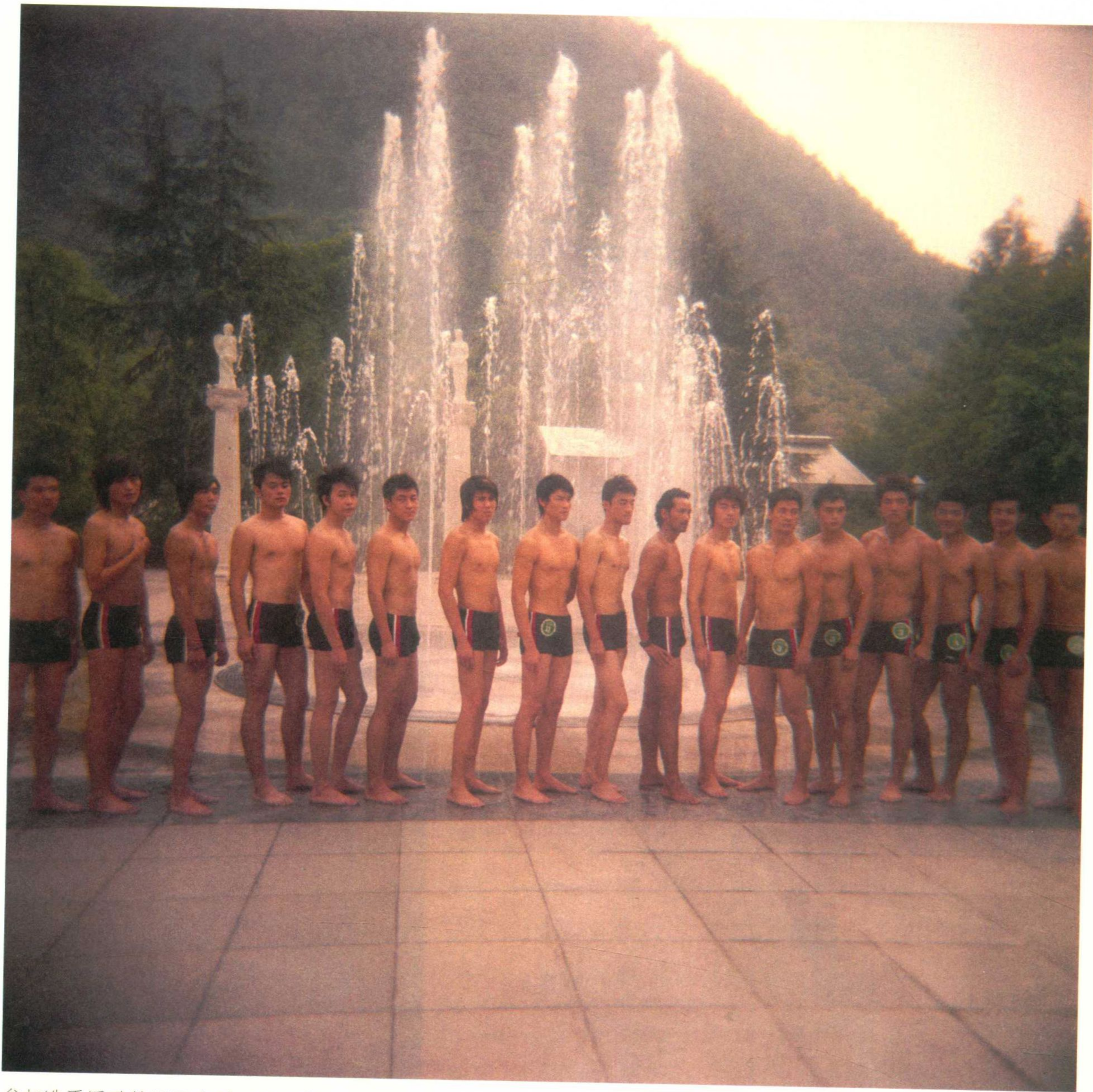
参加选秀活动的男子合影。2007年