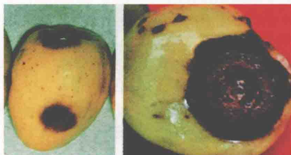
毛叶枣炭疽病 (何月秋)

防治方法 (1) 选用阎良脆枣等抗炭疽病品种。进行深耕，结合修剪剪掉病枝、枯枝，可减少初侵染源。(2) 4~5月份或发病初期喷洒1:2:200倍式波尔多液或28%三环·咪鲜锰可湿性粉剂1000~1250倍、25%溴菌晴乳油4000倍液、50%醚菌酯水分散粒剂4000倍液、25%吡唑醚菌酯乳油2000~2500倍液、25%啞菌酯悬浮剂1000~1300倍液，隔10天左右1次，防治2~3次。