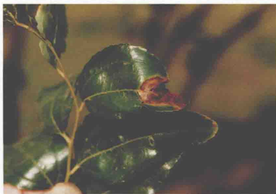
枣炭疽病叶片受害状

月病菌可能侵入上述部位，经1~2个月潜育进入7月中、下旬开始出现症状，8月雨日多病叶、病果扩展迅速，生产上降雨早、连阴天多、湿度大则发病早且重。