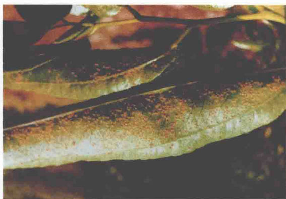
枣锈病叶背面的夏孢子堆 (蒋芝云)