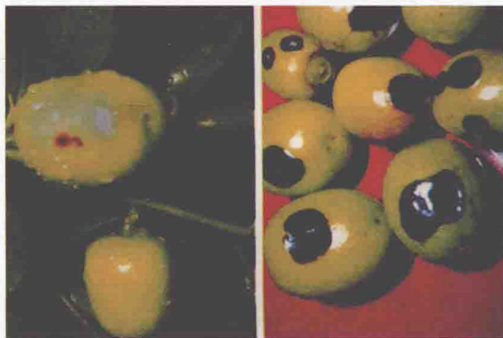
枣果上盾壳霉斑点病 发病后期症状