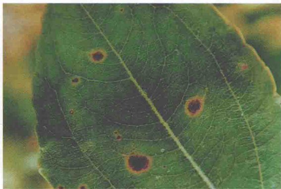
枣叶上的盾壳霉斑点病 (蒋芝云)

症状 主要为害叶片，多从枣树开花期开始发病，发病初期在枣叶上产生灰褐色至褐色圆形斑点，病斑边缘有黄色晕圈，大小为2～2.5mm，病斑多时可引起叶片黄化，影响枣树花期授粉、受精，常产生落花、落叶、落果。