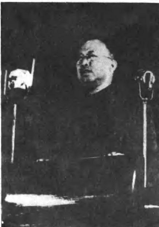
一九四八年八 月一日，罗荣桓在 哈尔滨召开的第六 次全国劳动大会上 致词。