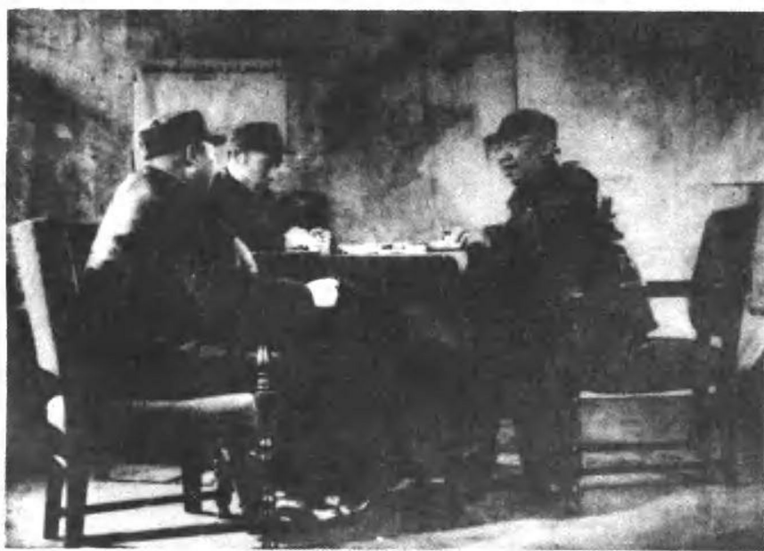
一九四九年一月，罗荣桓（右）与林彪（中）、聂荣臻（左）在部署平津战役。