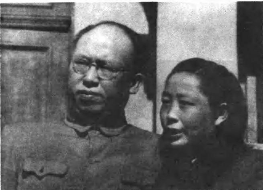
一九四八年， 罗荣桓及夫人林月 琴在东北。