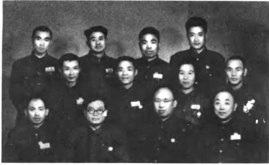
一九四九年九月，罗荣桓在北平和参加第一届中国政治协商会议的第四野战军全体代表合影。一排左起：李天佑、钟赤兵、罗荣桓、张轸；二排左起：苏静、韩先楚、丁志辉、刘梅村；三排左起：黄达宣、胡奇才、曾泽生、刘白羽。