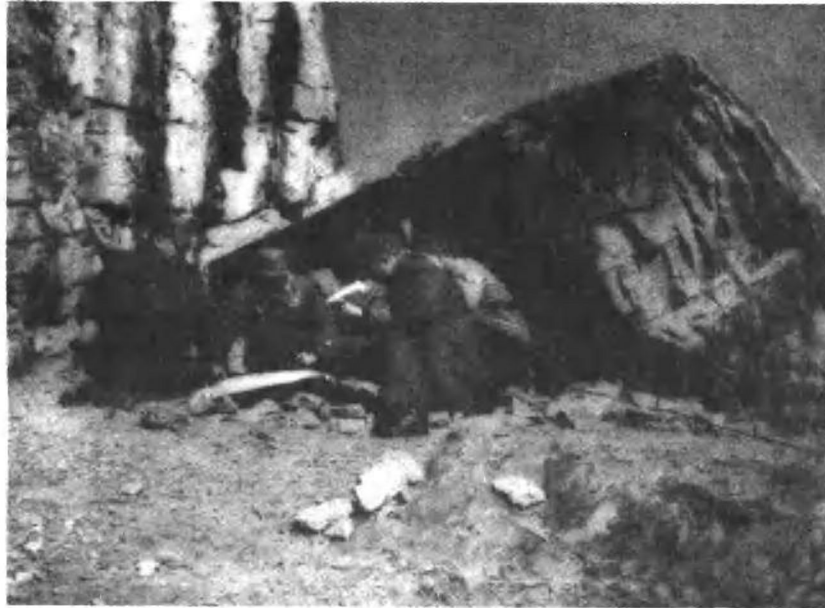
一九四八年辽沈战役中，东北野战军政委罗荣桓（左一）和司令员林彪（右二）、参谋长刘亚楼（左二）在锦州前线指挥作战。