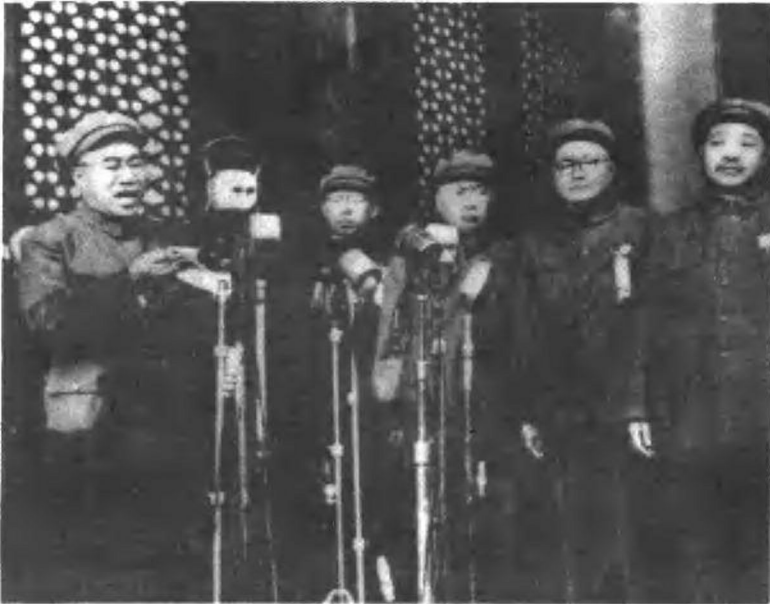
一九四九年十月一日开国大典，罗荣桓等领导人在天安门城楼上。左起：朱德、罗荣桓、陈毅、刘伯承、贺龙。