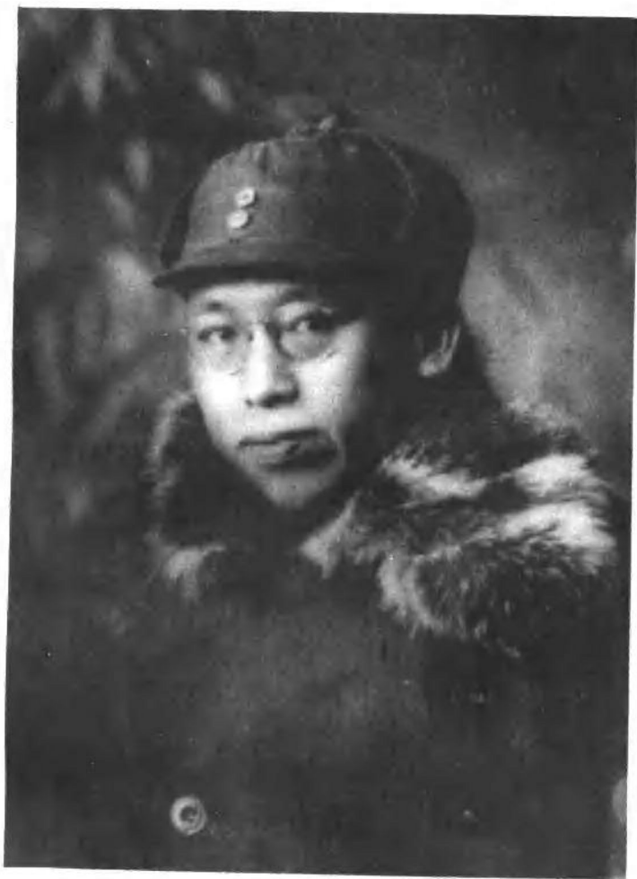
一九四六年初，罗荣桓在安东（今丹东）。