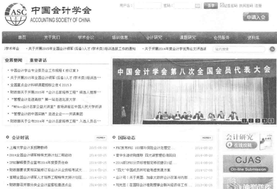
图 1.2 中国会计学会官网

中国会计学会(图 1.2)是由全国会计领域各类专业组织及个人自愿结成的学术性、专业性、非营利性社会组织。各省、自治区、直辖市和计划单列市会计学会和全国性专业会计学会可申请成为中国会计学会的会员。