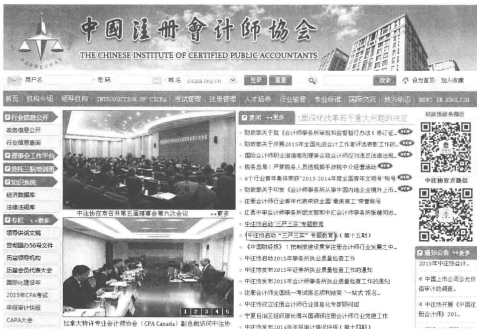
图 1.1 中国注册会计师协会官网