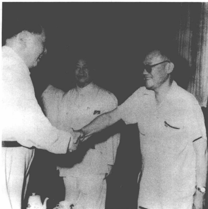
全国第三次文代会时毛主席接见 (1960)