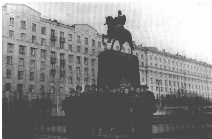
在莫斯科参加十月革命四十周年庆祝活动 (1957) 左起: 苏联友人、马思聪、巴金、田汉、老舍、苏联友人、梅兰芳、喻宜萱、阳翰笙、王昆、苏联友人