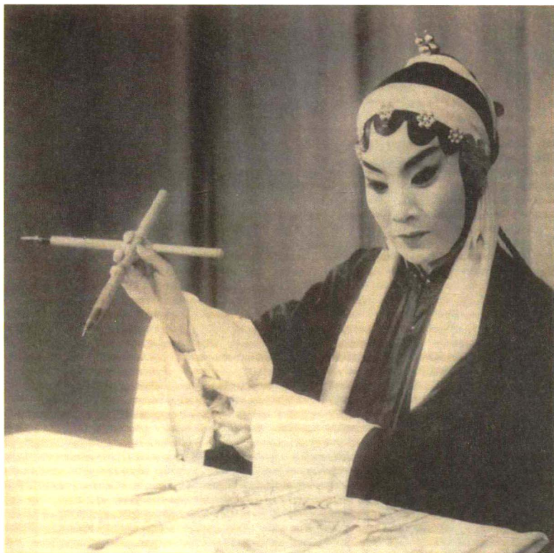
在《琵琶上路》中饰赵五娘