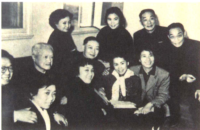
1960年彭俐侬（前排左二）参加梅兰芳戏曲表演训练班留影，中坐者为梅兰芳