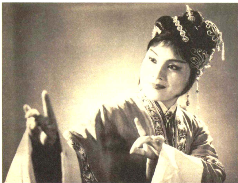
在《拜月记》中饰王瑞兰