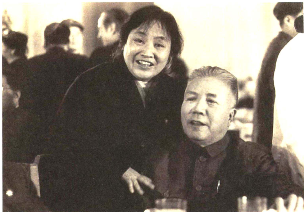
1979年在全国第四次文代会上与周扬合影