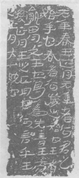
东汉《公羊传》砖刻拓本

湖南长沙马王堆一号汉墓出土，其抄写年代当在汉高祖卒年之前。这是《老子》最早的手抄本，现藏于湖南省博物馆