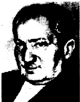
马丁·海德格尔 (Martin Heidegger, 1889 ~ 1976), 德国哲学家。