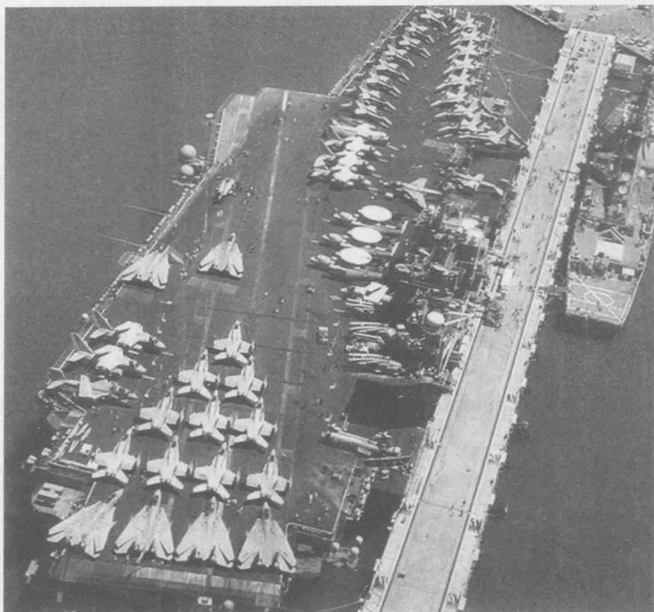
○ 航母上摆满飞机，“盛装”停靠在珍珠港。

因为全部是英文，而且不是我在美国的这几年所熟悉的日常用语，所以我觉得有些吃力。因为觉得主动权在我这边，我大言不惭地问征兵官：“有没有中文版的考试题啊？”