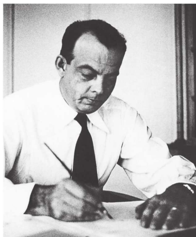
圣埃克苏佩里在写作中