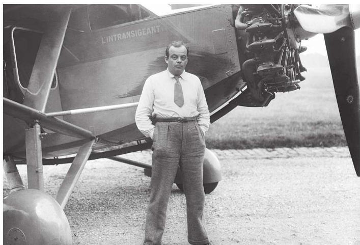
圣埃克苏佩里在曾驾驶过的飞机旁留影