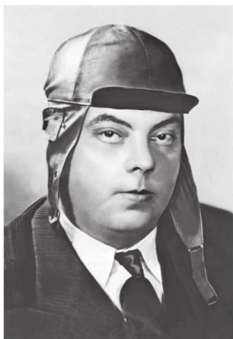
戴飞行帽的圣埃克苏佩里