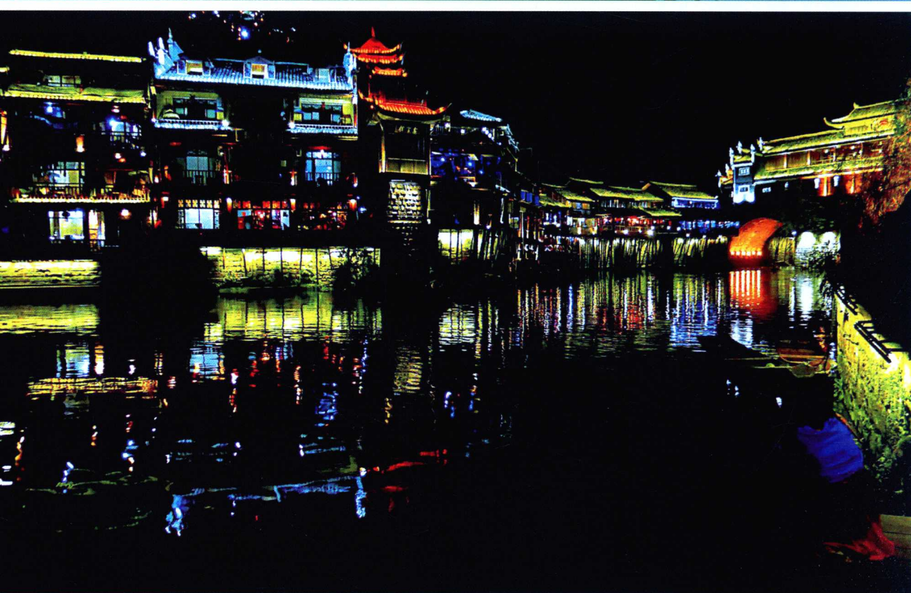
📍 湘西秘境中的最美小城——凤凰