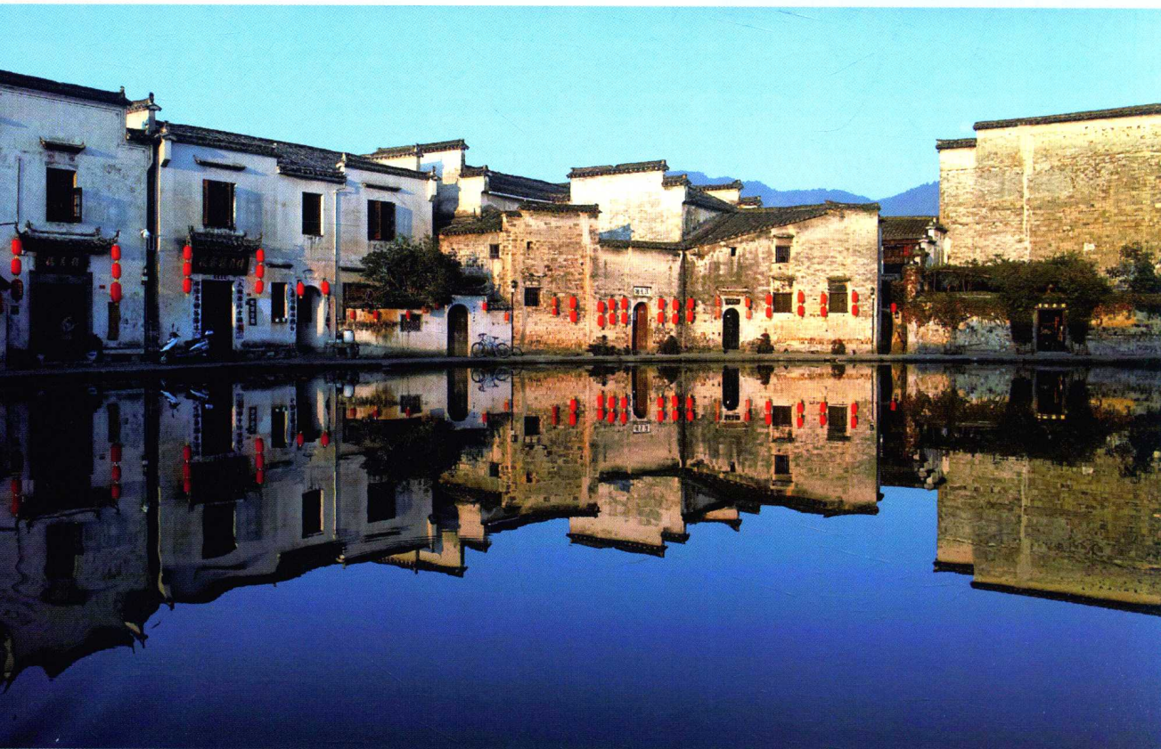
📍 东方人居智慧的代表——宏村