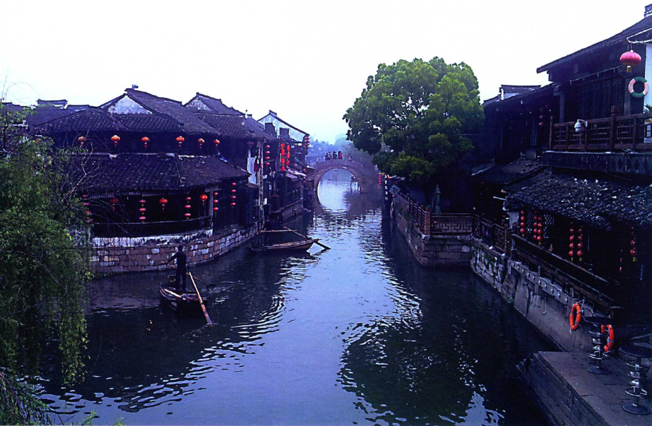
📍 建筑与生活的相互守望——活着的千年古镇西塘