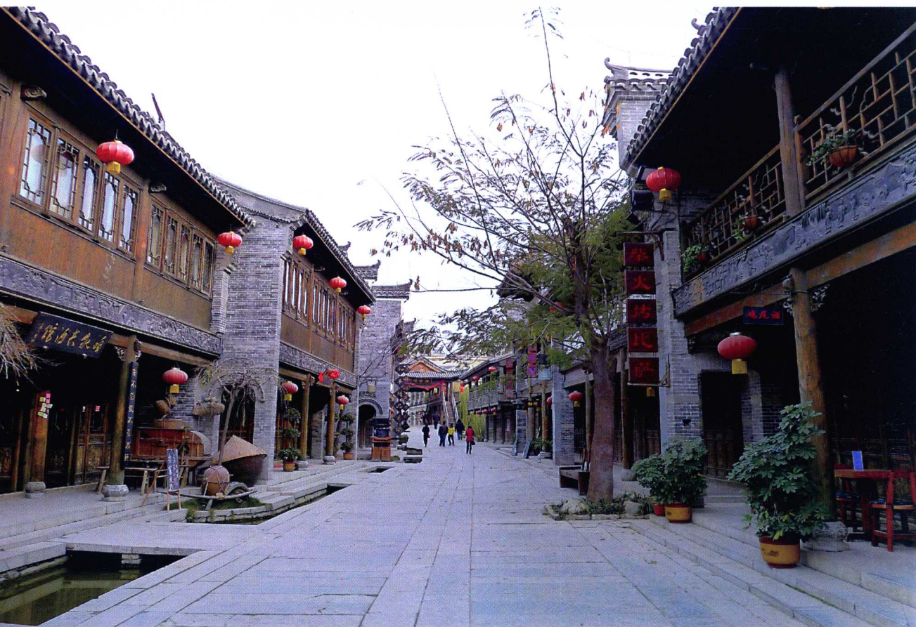
匠心天工的人造古城——台儿庄