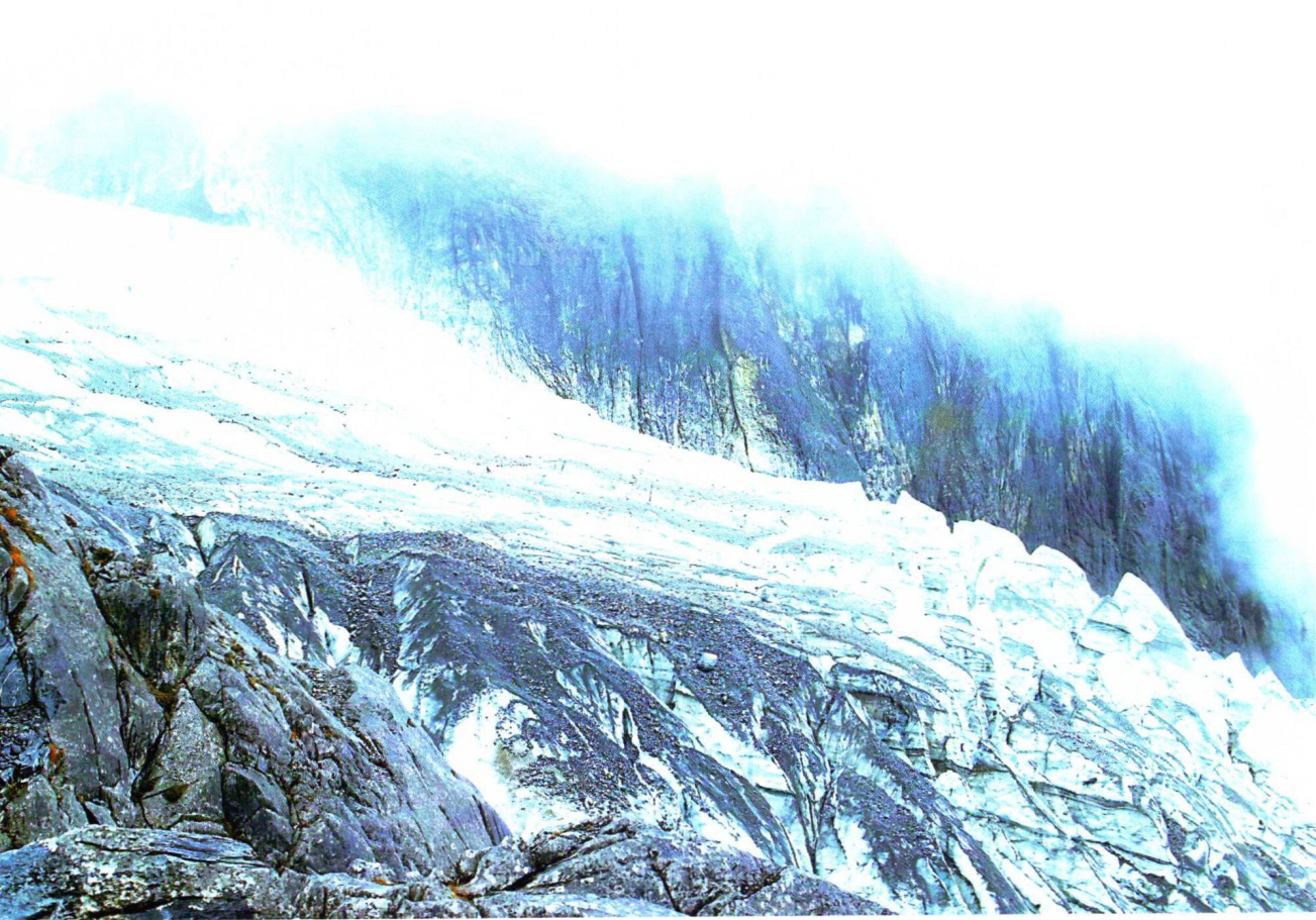
📍 玉龙雪山的如瀑冰川