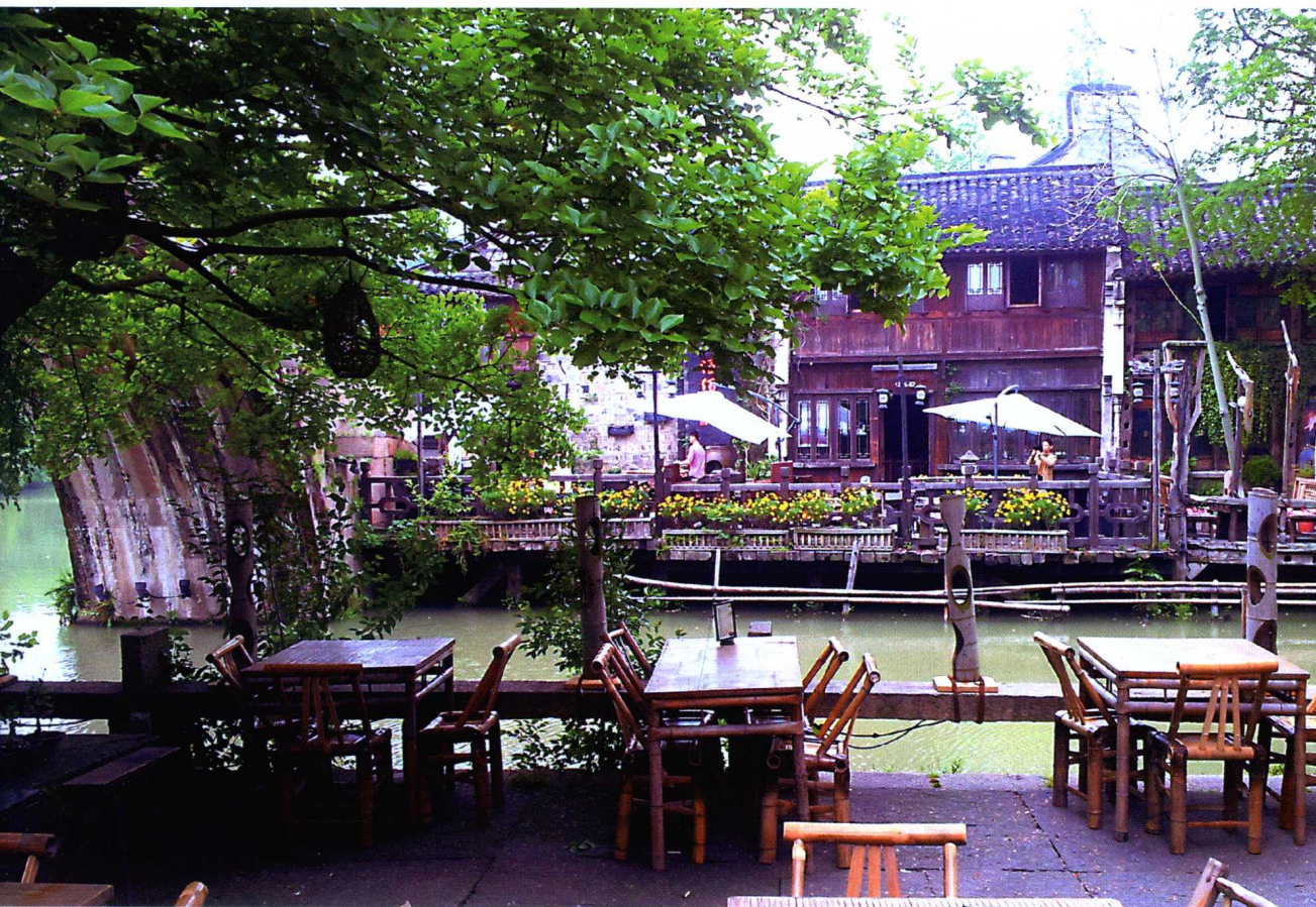
📍 小桥流水人家——江南印象的集萃者乌镇