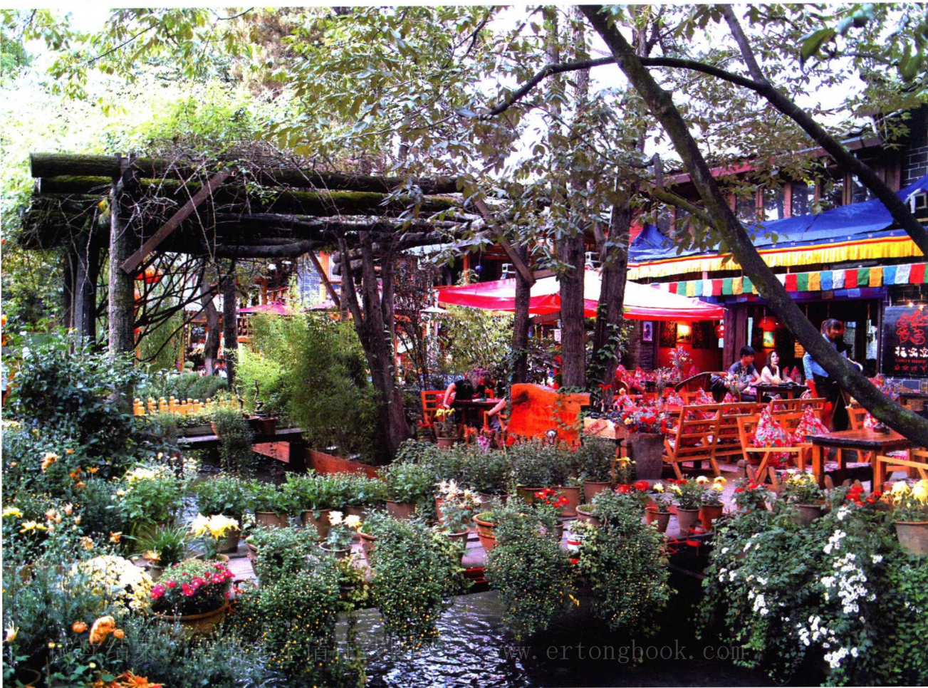
📍 水环花簇的丽江酒吧