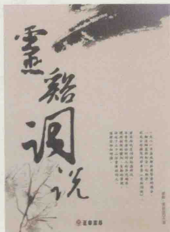
(台北) 正中书局 2013年版