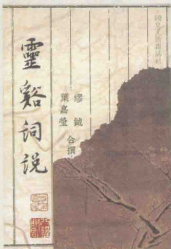
(台北) 国文天地出版社 1989年版