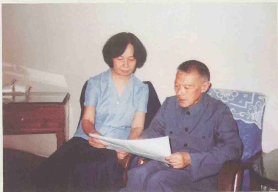
作者讨论文稿（摄于1983年夏）