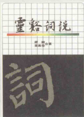
(台北) 正中书局 1993年版