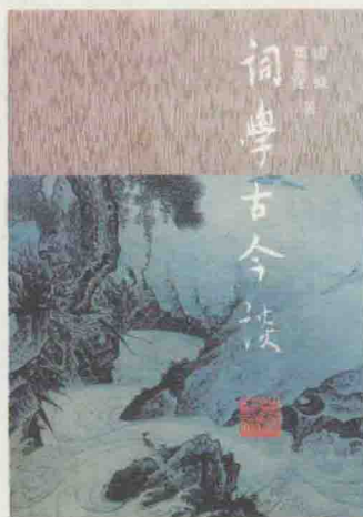
岳麓書社 1993年版(精裝本)