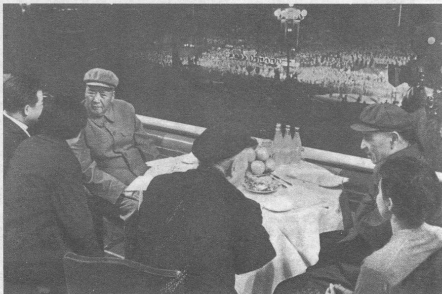
一九七一年五月一日是林彪出逃前最後一次公開露面，上圖為他陪同毛澤東在天安門城樓；下圖為他與（左起）毛澤東、西哈努克、翻譯齊宗華、董必武、西哈努克夫人在一起。但林彪祇坐了三十分鐘就匆匆離去。