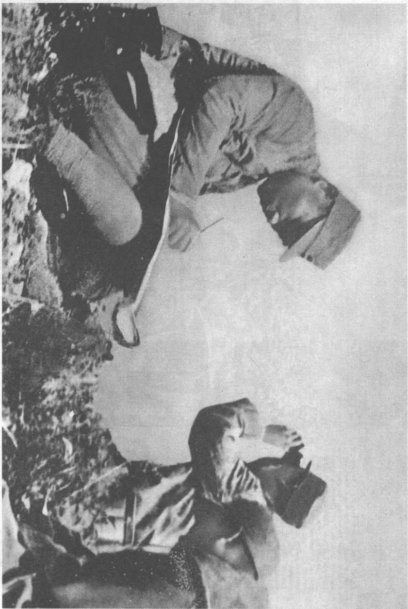
林彪首次揚名中外是在抗日戰爭平型關戰場，圖為他（左一）當時在戰場上。（一九三七年九月）