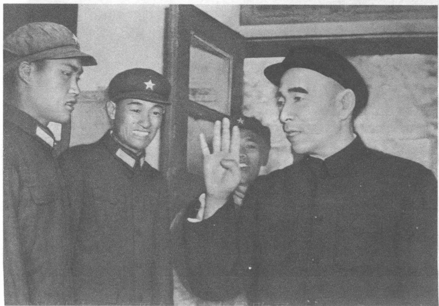
林彪當上國防部長後視察部隊。（一九六三年）