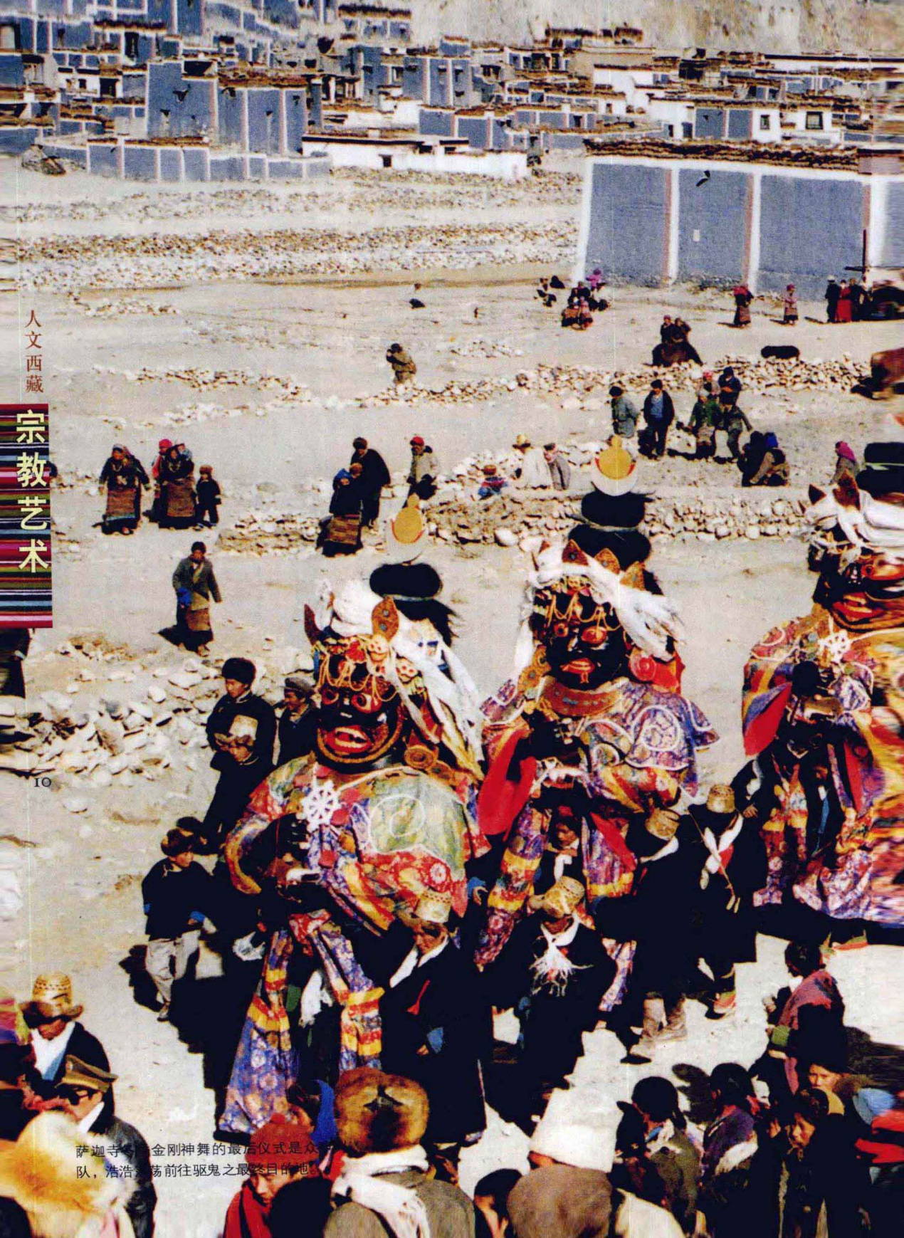
萨迦寺金刚神舞的最后仪式是众人排队，浩浩荡荡前往驱鬼之最终目的地。