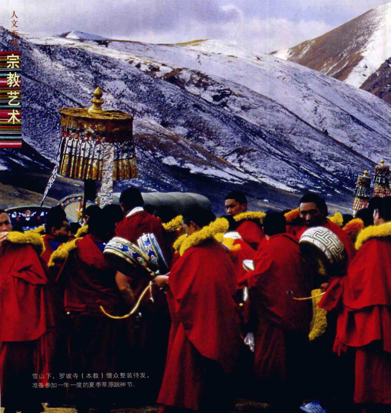
雪山下，罗坡寺（本教）僧众整装待发，准备参加一年一度的夏季草原跳神节。