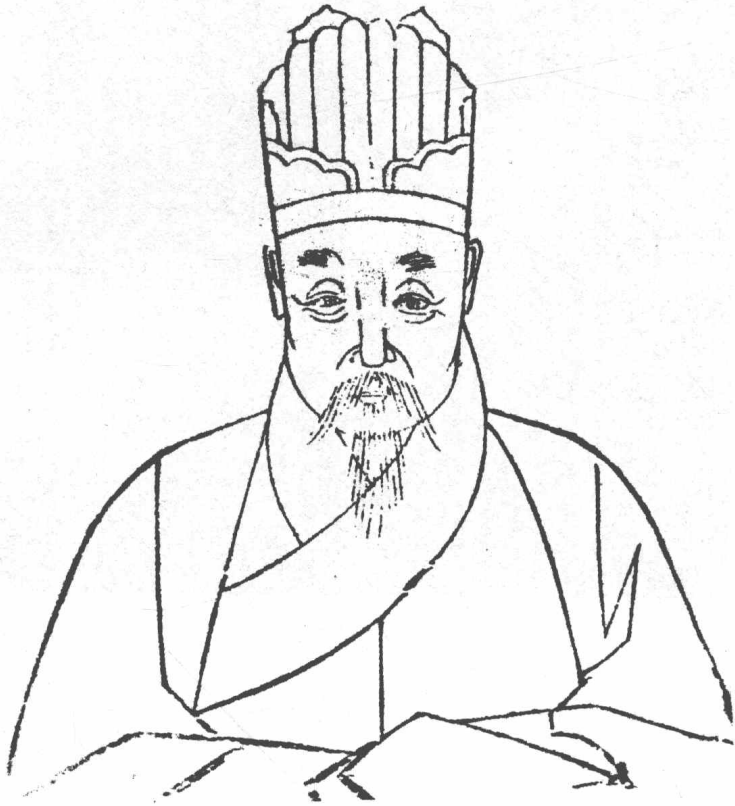
明·馮從吾像 (一五五七—一六二七)