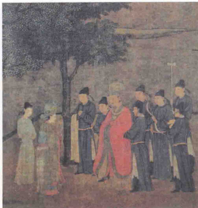
《女孝经图》（局部） 画中皇帝着通天冠服，皇后着龙凤花钗团冠服。二人身旁皆内侍与宫女。