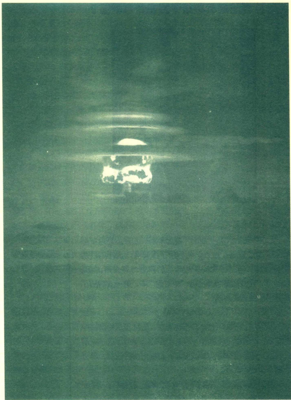
1954年5月4日，美国进行的TNT当量达1350万吨的氢弹试验