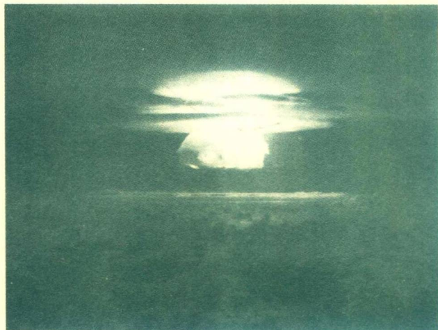
撒旦的烟火——犹如世界毁灭前夕的血色辉煌 (1954年3月1日美国进行的核试验)