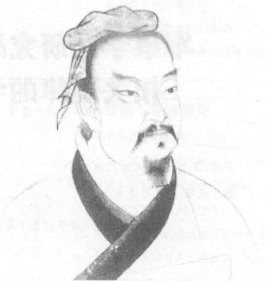
孙子,春秋时代(前 770—前 476)后期,齐国人