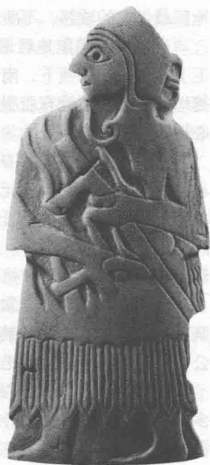
手持战斧的苏美尔战士

公元前3000年左右的时候，乌尔是苏美尔地区的一个大都市，号称月神之城。因为月神南娜和他的妻子宁伽尔是乌