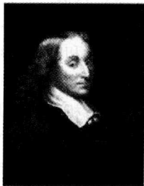
图 1-1 帕斯卡

帕斯卡 1623 年 6 月 19 日出生于法国奥弗涅的克莱蒙费朗市 (Clermont-Ferrand), 自幼聪颖, 从小喜欢数学。在数学家父亲的教育下, 12 岁开始学习几何, 通读欧几里德 (Euclid) 的《几何原本》(Elements) 并掌握了它。他独自发现了欧几里德的前 32 条定理, 而且顺序也完全正确。与此同时, 发现了“三角形的内角和等于 180 度”。1639 年发表著名的帕斯卡六边形定理: 内接于一个二次曲线的六边形的三双对边的交点共线, 因此 16 岁就成为巴黎数学家和物理学家小组 (法国科学院的前身) 成员。1640 年 17 岁的帕斯卡在他的一篇数学论文《论圆锥截线》中提出了一条定理, 后人把它叫做帕斯卡定理。他还提出了著名的帕斯卡三角形, 阐明了代数中二项式展开的系数规律, 这些结论