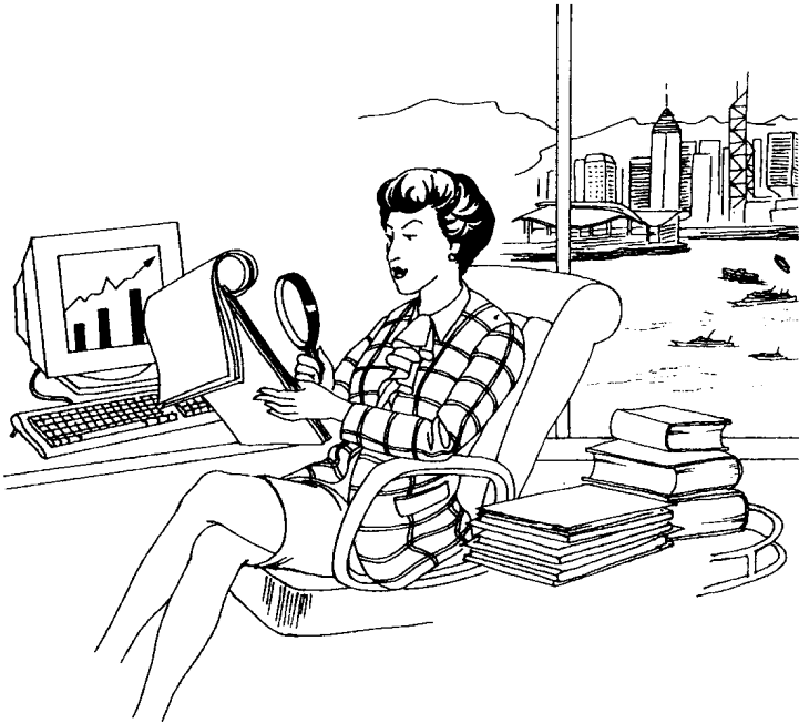
图 1.1 行政人员会利用各种不同的会计分析作出商业的决定