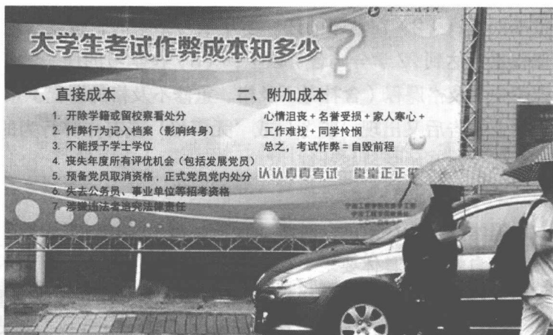
图 1.2 宁波工程学院考试作弊成本海报