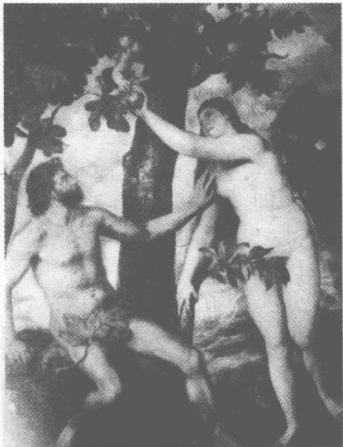
亚当与夏娃之诱惑