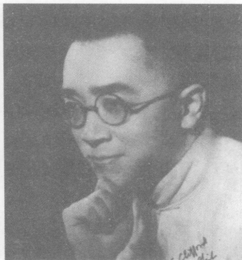
任北大教授时的胡适