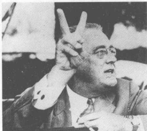
罗斯福 | Franklin Roosevelt

1945年，可以看成人类历史上成就最大的一年。1945年，纳粹法西斯恐怖统治在欧洲终结，日本帝国主义的侵略和统治也被画上了句号。