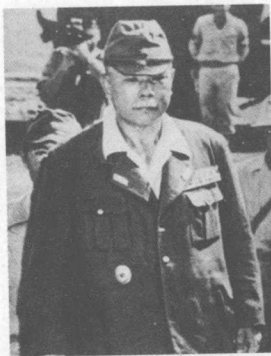
山下奉文 | Tomoyuki Yamashita

美国陆军五星上将，参加过第一次世界大战。1919年任西点军校校长，1922年赴菲律宾，任马尼拉特区司令。1925年晋升少将，回国后任第3军区司令。1928年任驻菲美军司令。1930年任美国陆军参谋长。1935年任菲律宾政府军事顾问，次年被授予菲律宾陆军元帅称号。1941年7月任远东美军司令。1942年任西南太平洋盟军总司令。