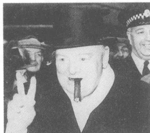
丘吉尔 | Winston Churchill

这次胜利在美国历史中将受到长久珍视。除了英勇、技巧和胆量之外，它比我们所曾经见过的任何一次胜利对未来作战都产生更加生动、更深远的影响。