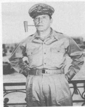
麦克阿瑟 | Douglas MacArthur

美国陆军五星上将，参加过第一次世界大战。1919年任西点军校校长，1922年赴菲律宾，任马尼拉特区司令。1925年晋升少将，回国后任第3军区司令。1928年任驻菲美军司令。1930年任美国陆军参谋长。1935年任菲律宾政府军事顾问，次年被授予菲律宾陆军元帅称号。1941年7月任远东美军司令。1942年任西南太平洋盟军总司令。